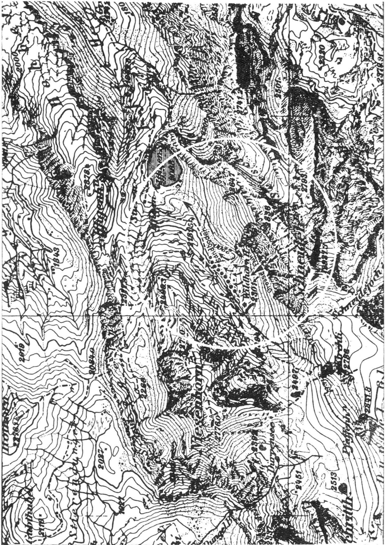
Région de la cabane du Wildhorn.