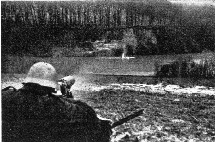
Vue sur la falaise de la rive dr. 4 sentinelles étaient placées dans un rayon de 500 m. au delà de la falaise. Coupure dans la haie rive g. d'environ 160 ‰.