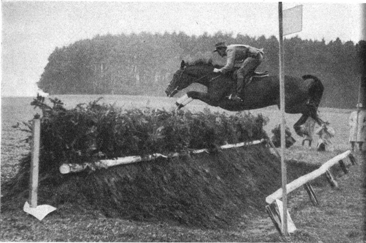
FIG. 4. — Le capitaine H. Schwarzenbach, avec Vae Victis , au passage d'un obstacle de l'épreuve de steeple-chase du Military national pré-olympique du Flaachtal, qu'il franchit dans le meilleur style.

Si l'équitation a recruté ces derniers temps beaucoup d'adeptes parmi les civils, on est tout de même frappé, dans ce tour d'horizon que nous propose « L'Année Hippique », et qui s'étend à trois continents, de constater que tous les pays entretiennent encore, sinon une cavalerie, du moins une phalange de jeunes officiers qui les représentent dans les compétitions. Je pense que cela permet de laisser subsister dans l'armée, à cause de ces petits groupes, ou par l'influence de ceux qui font aux centres équestres des stages d'une certaine durée, l'esprit cavalier. Le côté éducatif de l'équitation militaire n'a pas échappé à ceux qui forment des chefs. Ne faut-il pas souhaiter, que, chez nous, cette face du problème