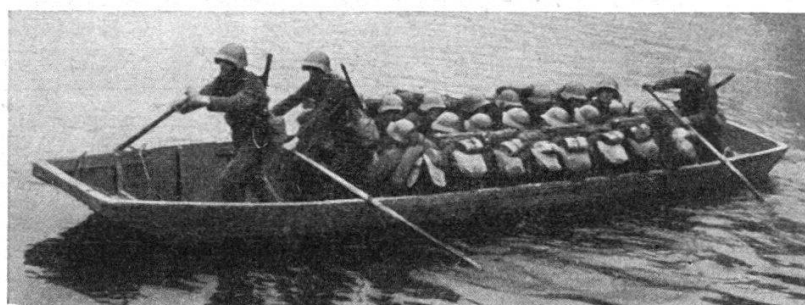
FIG. 3. — Nacelle de traversée avec groupe de fusiliers.

position d'attente et sont amenées par groupes dans la proximité du cours d'eau à franchir. La route à suivre est jalonnée par la police routière. Les camions stoppent en un point éloigné de quelques kilomètres afin que leur bruit ne trahisse pas les préparatifs de l'opération, ce qui anéantirait l'effet de surprise nécessaire au succès. Aussitôt, les hommes du génie déchargent les nacelles, placent chacune