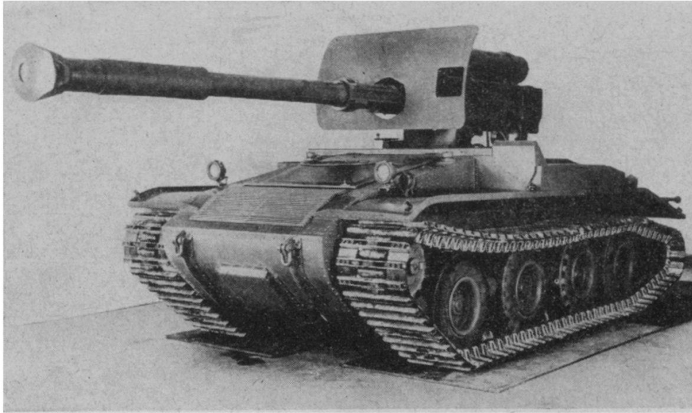
FIG. 2. — Canon chenillé antichars de 90 mm.

moins de 8 tonnes contre 16 à notre G13 et 30 au SU85 . Son moteur de 205 chevaux lui assure une vitesse maximum de 48 kmh. Enfin, sa légèreté et ses dimensions lui permettent de prendre place à bord d'un avion de transport du type C119 ,