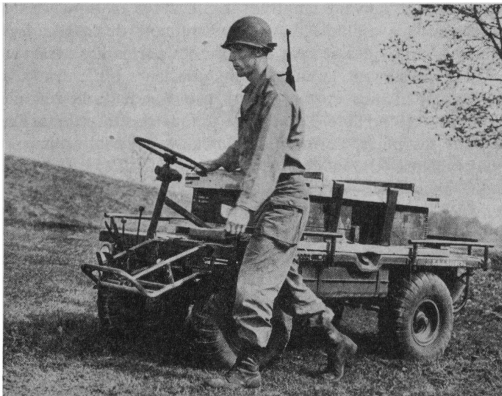
FIG. 4. — La « mule mécanique ».

la première ligne du champ de bataille, et qu'elle se camouflera facilement. Elle pèse 300 kg., soit 50 de moins que la Vespa 2CV. dont on annonce la sortie d'usine, et peut se charger à 450 kg. Ses quatre roues étant directrices, elle peut tourner dans un cercle de 5 m. 4. Comme le montre la figure 4,