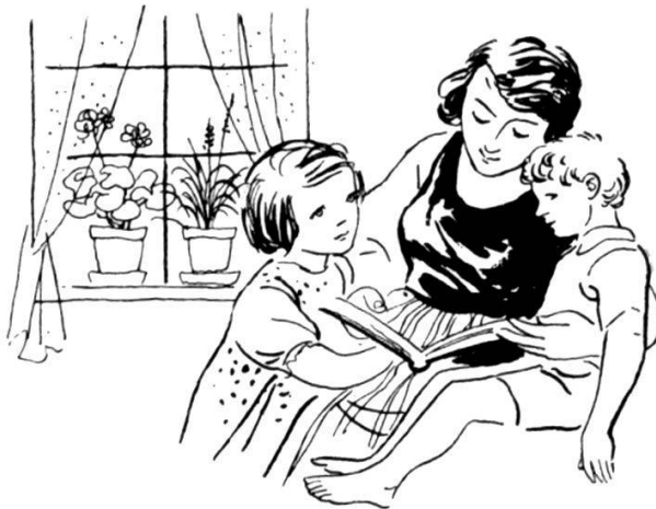
Le rôle de la femme dans le pays

La seconde partie, naturellement, est de loin la plus importante. C'est celle qui aborde la vie militaire, les devoirs du soldat dans le cadre de son unité, les devoirs du soldat au combat, enfin, le combat lui-même.