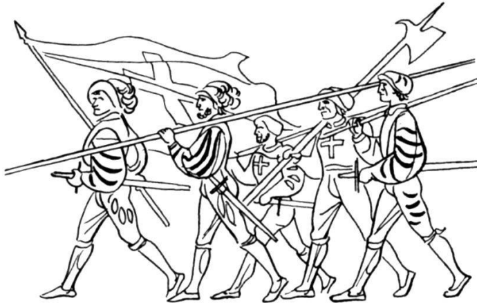
Résumé chronologique - Etapes de l'évolution de la Confédération

La seconde partie, naturellement, est de loin la plus importante. C'est celle qui aborde la vie militaire, les devoirs du soldat dans le cadre de son unité, les devoirs du soldat au combat, enfin, le combat lui-même.