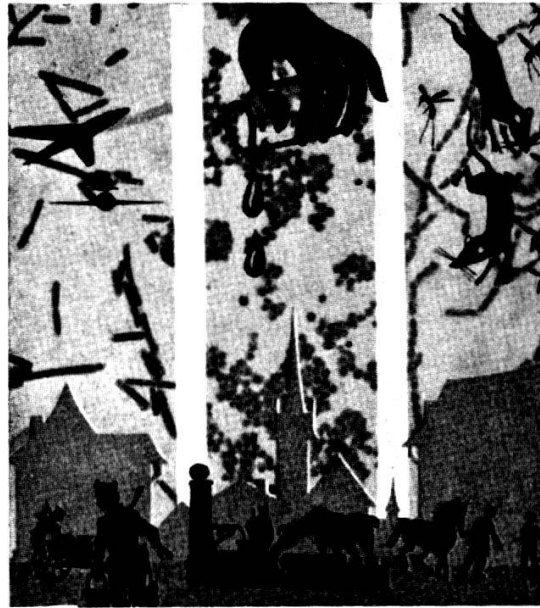
Les avantages des blindés