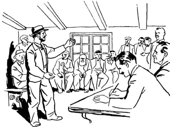
Nos communes - Droit de bourgeoisie - Administration autonome

La première partie rassemble, parfaitement bien résumés, les principes de base qui étayent l'existence même de notre pays. Ces chapitres sont une véritable charte de nos privilèges, et on ne peut que se féliciter de les voir exposés aussi largement au début de ce « Livre du Soldat », où ils trouvent si naturellement place. Les devoirs qui résultent de ces droits, de ces privilèges dont nous sommes, à juste titre, fiers, en découlent dès lors comme une suite normale. La Défense nationale d'aujourd'hui apparaît comme la continuation logique de quelque sept siècles de luttes, pour des libertés que l'histoire nous montre toujours remises en question, et que nous devons nous garder de jamais croire définitivement acquises. On n'aurait mieux su choisir d'introduction à la vie militaire que ce large exposé de ce qui est, somme toute, sa justification et sa raison d'être profonde.