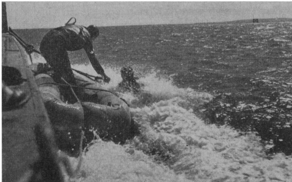
FIG. 3. — Sa tâche terminée, il est repris à bord.

Doucement le « cochon » s'avance au ras de l'eau, puis plonge obliquement vers l'infrastructure du navire. Dans l'obscurité épaisse, Visintini sent son véhicule racler la coque et tâte le flanc du cargo. Au balai, il règle l'immersion jusqu'à