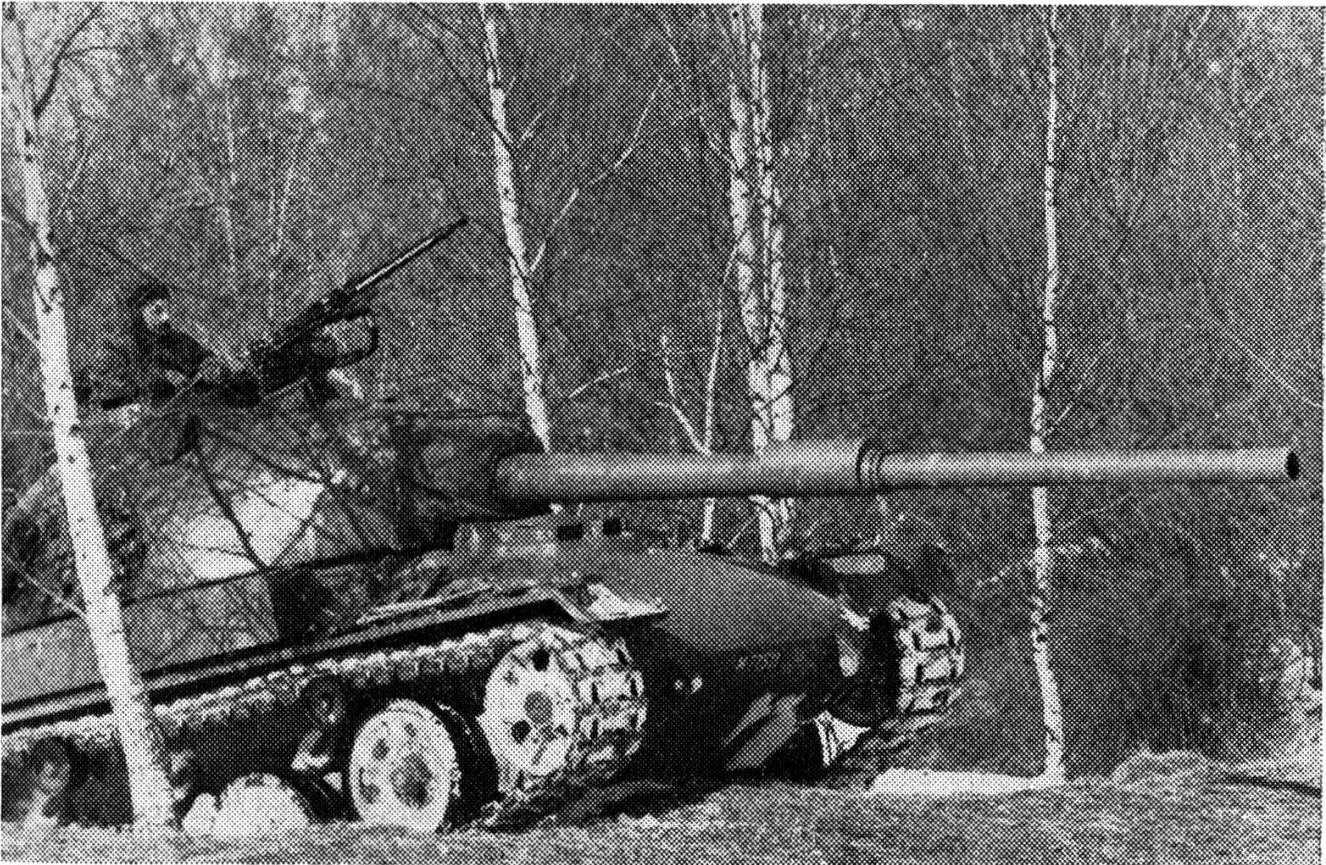
Malgré la grande inclinaison du bassin, le tube du canon peut être fortement baissé vers le sol, grâce à la silhouette un peu plus haute du char.