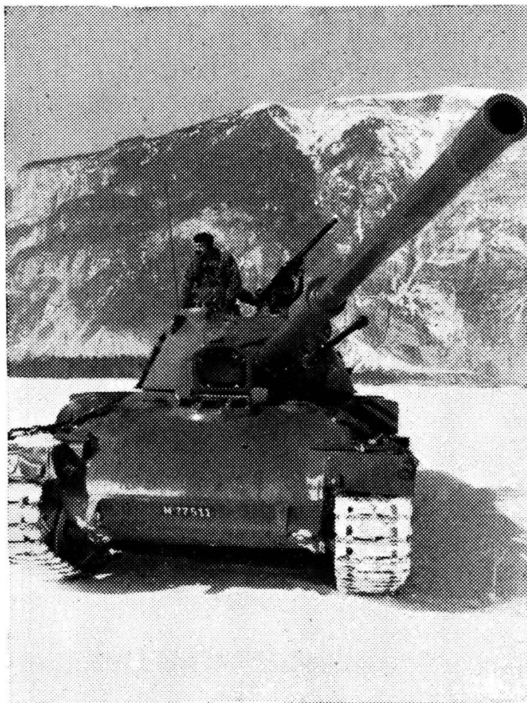
Le char 61 avec son canon de 10,5 cm, le canon automatique de 20 mm parallèle au tube et la mitrailleuse 51, de 7,5 mm affûtée sur la tourelle. Le Calanda au fond offrait une sécurité absolue pour des exercices de tir, mais les grands calibres et la munition de guerre sont interdits.

Le canon automatique de 20 mm, parallèle au tube, a une cadence de 800 coups la minute et la mitrailleuse 51 de 7,5 mm, affûtée sur