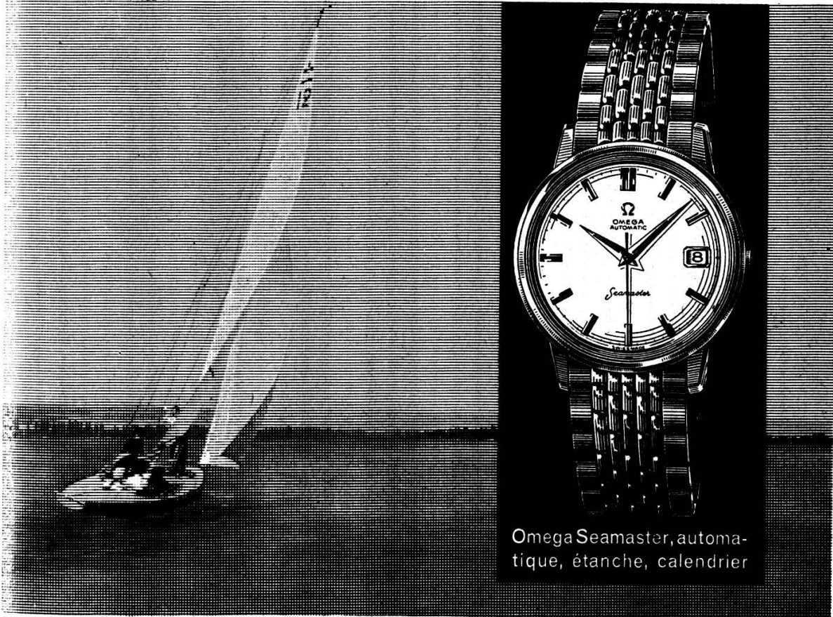
Omega Seamaster, automatique, étanche, calendrier