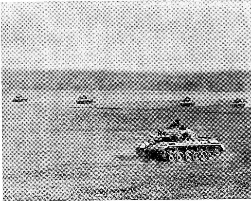
Déployés dans le terrain, les Centurions attaquent.

longue portée et à trajectoire tendue: les canons de chars, les canons à tir rapide, les mitrailleuses lourdes. L'infanterie portée dans les véhicules blindés se bat de diverses manières depuis le véhicule même. Elle ne débarque que lorsque commence le combat rapproché proprement dit.