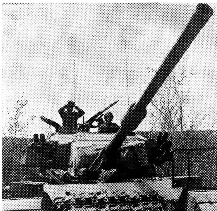
Grâce à son canon de 10,5, le char de combat Centurion peut se mesurer avec n'importe quel adversaire. Les Centurions constituent la majorité des chars de combat dont nous disposons.

Les divisions mécanisées comprennent aussi, outre les régiments blindés, un régiment d'infanterie motorisé. On s'en souvient, sa composition avait déclenché de vives discussions. Comme dans la plupart des questions controversées de notre politique militaire, les objections étaient en partie fondées, tandis que d'autres étaient moins plausibles. Le défaut le plus important de cette formation est que ses camions transportant un groupe de fusiliers, quoique partiellement tout-terrain, ne sont pas des véhicules de combat, qu'ils doivent être abandonnés par les fantassins au seuil de la zone de combat et qu'ils forment des colonnes relativement lourdes, très exposées aux attaques aériennes. Toutefois, de nuit et par mauvaises conditions atmosphériques, les fantassins motorisés sont capables, grâce à leur habilité à résoudre les problèmes des