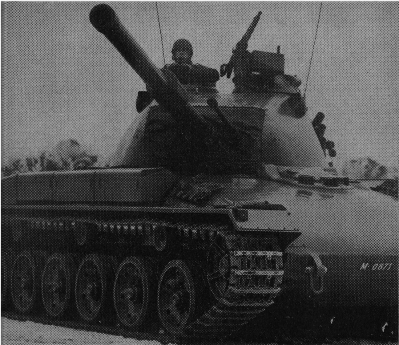
Le char suisse 61 est en voie d'introduction. Il est doté d'un canon de 10,5 et, en outre, d'un canon de 20 mm à tir rapide.

déplacements motorisés, de se mouvoir sur notre réseau routier, dense et bien entretenu.