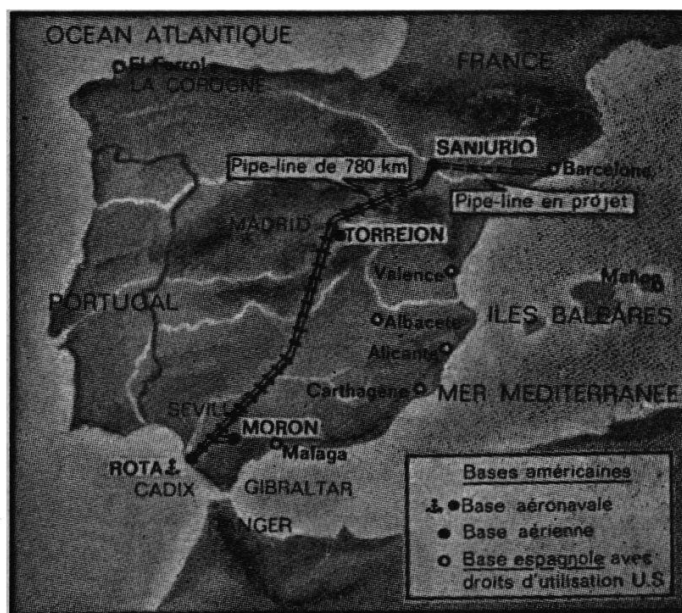
Carte du N° 4 1966 p. 177 1

Quand on sait qu'il s'agit d'une brigade de la valeur d'un de nos régiments d'infanterie renforcé, il semble que les moyens publics d'information ont, une fois de plus, monté en épingle cette nouvelle en la titrant, comme l'a fait un de nos quotidiens romands : « Le Canada réduit ses « forces » à l'OTAN ».