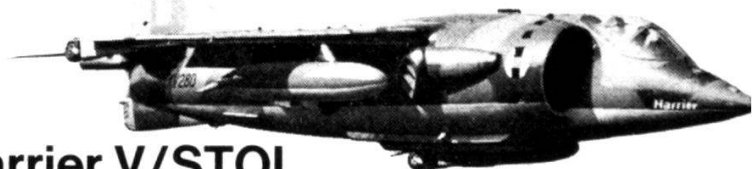
Le HS Harrier V/STOL

Seuls les avions Harrier seront capables de réagir immédiatement après une attaque aérienne.