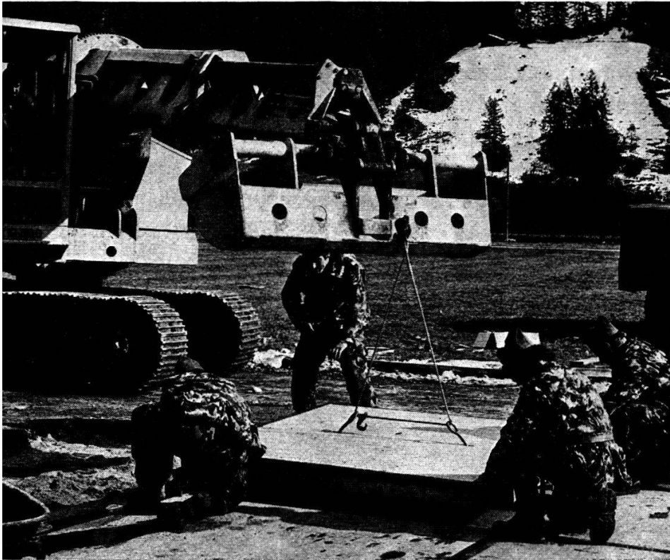
Une cp G av en pleine réparation d'une piste.

Après un bombardement, la remise en état des pistes est une des missions très importantes du rgt aérod.