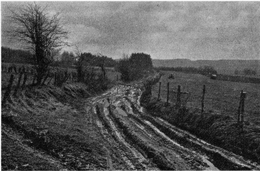
Etat des chemins après des précipitations. Axe de l'attaque allemande contre Marvie (photo prise en 1970).

de 0° C. Le gel ne se fait sentir que du 23 au 31, mais le thermomètre ne baisse jamais au-dessous de —8° C. Ces précipitations rendent le terrain très mou; d'autre part, l'épaisseur de la neige empêchera plus tard les chars de se déployer dans le terrain. Quand on sait que les Allemands vont utiliser surtout des formations blindées, on peut admettre que ces conditions atmosphériques empêchent aussi les Allemands de prendre Bastogne.