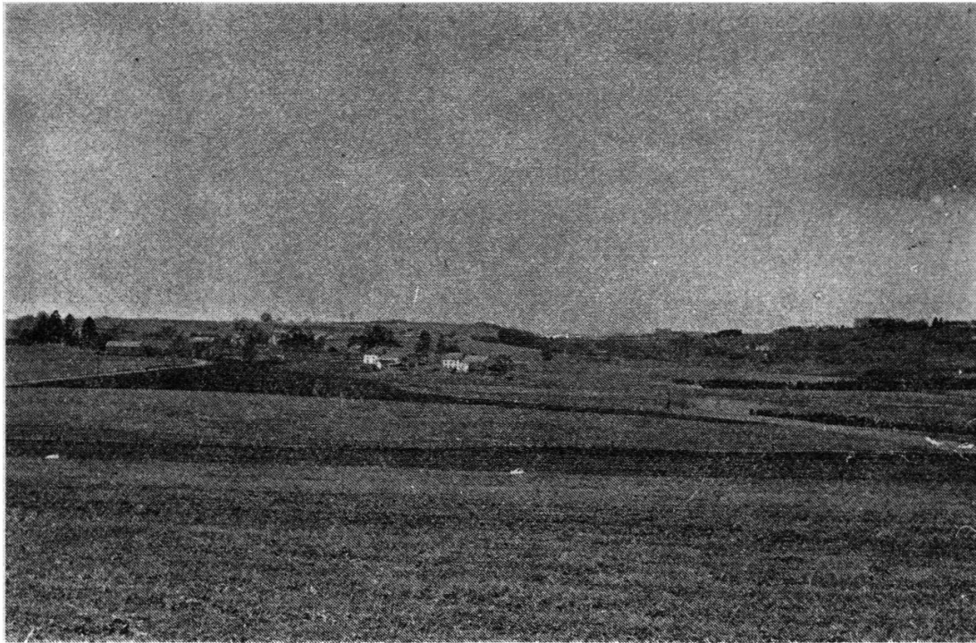
Le terrain autour de Bastogne. A gauche, le village de Mont; au centre, à l'arrière-plan, les premières maisons de Bastogne (photo prise en 1970).

semblable au Plateau suisse. Clervaux et Wilz sont aussi situées au fond d'une cuvette: cependant, les troupes d'Hitler occupent ces deux localités, au début de leur offensive. Elles pourront donc progresser dans un terrain beaucoup moins tourmenté, et le haut commandement pourra faire avancer rapidement ses formations mécanisées, le dispositif américain apparaissant très dilué.