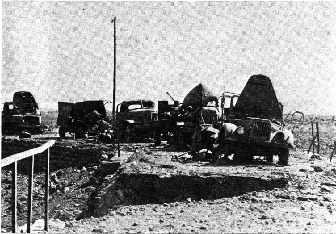
Convoi syrien stoppé par l'aviation israélienne sur un pont.

tiative. Il est donc probable, dans un nouveau conflit, que les Arabes chercheront à lancer l'offensive les premiers; comme les Israéliens sont bien décidés, si nécessaire, à faire de même, l'état de préparation des armées régulières sera déterminant, ce qui implique en conséquence — et c'est une deuxième leçon — qu'il faudra appliquer mieux encore qu'en 1973 un caractère rigoureux et scientifique à la préparation d'une nouvelle guerre. La troisième leçon a été tirée sur le plan tactique où les capacités d'improvisation des armées syrienne et égyptienne se sont trouvées en défaut. Par ailleurs — quatrième leçon — les commandos, particulièrement égyptiens, se sont révélés totalement inefficaces. Dans une moindre mesure, et c'est un cinquième enseignement, l'état-major égyptien aura à remédier à une insuffisante prestation de ses tanks en octobre 1973 et pourra continuer à développer l'efficacité de son infanterie dont le rôle a été capital dans la lutte antichars grâce à l'utilisation des missiles portatifs Sagger. Enfin, l'Egypte devra se montrer plus rapide et plus décidée sur le terrain (l'eût-elle été au début de la guerre et eût-elle osé franchir les cols de Giddi et Mitla, que la guerre eût pris sans doute une tout autre tournure). Paradoxalement, c'est à plus de prudence