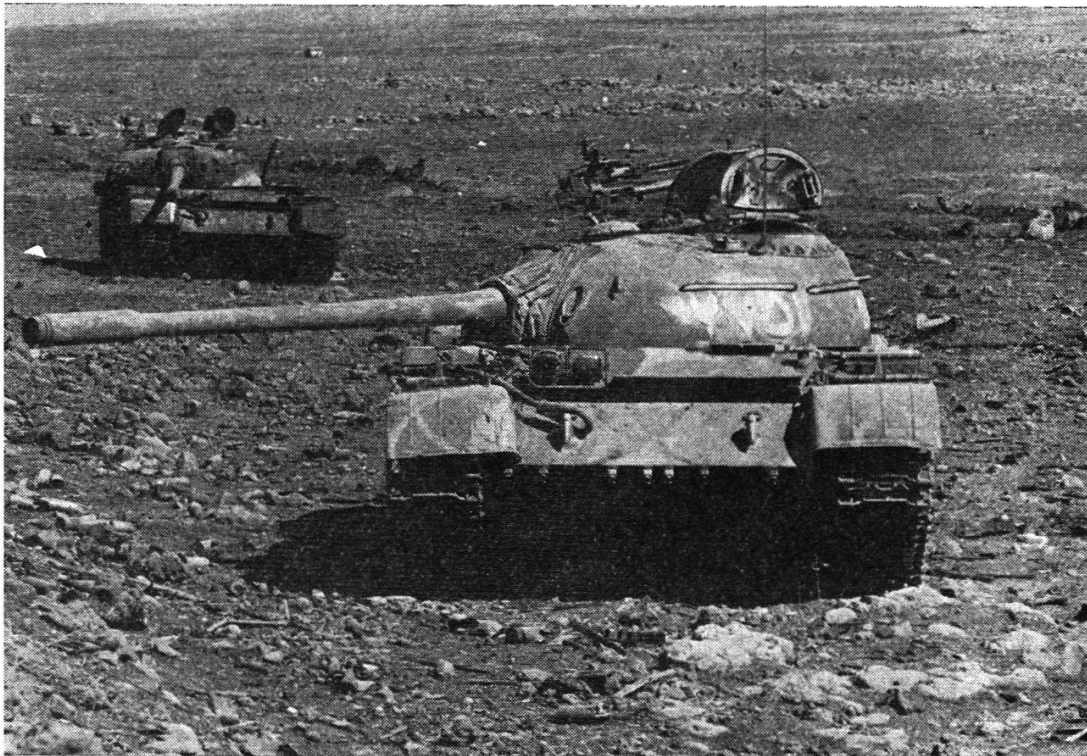
Carcasses syriennes de la plus gigantesque bataille de chars de l'histoire (T. 55).

que devra se contraindre la Syrie si elle veut éviter de voir — comme en octobre 1973 — ses blindés trop rapides coupés de l'appui de l'infanterie.