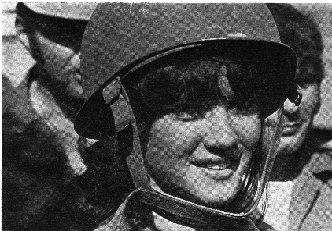
Jeune soldate israélienne dans le Sinaï.

Cette cinquième guerre serait, selon les mêmes commentateurs, une guerre longue et toutes les ressources arabes seraient mobilisées dans ce que Mohamed Hassanein Heykhal, ancien rédacteur en chef de Al-Ahram , a symbolisé comme la combinaison de deux axes: l'axe stratégique, allant du nord-est au sud-ouest et reliant Damas au Caire; l'axe économique, financier et politique, horizontal, reliant, d'ouest en est, les extrêmes du monde arabe tout entier.