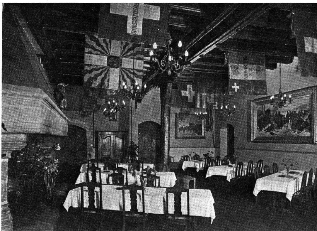
La salle des drapeaux.

On passe ensuite dans la salle où sont conservées les magnifiques pièces que l'Etat a pu acquérir de la collection Strüblin, soit en particulier une cinquantaine de pistolets et quelque 30 épées et armes blanches. C'est aussi dans cette salle que sont regroupées les pièces signées d'artisans neuchâtelois. Une vitrine est consacrée à la seule conservation de trois pièces de haute qualité, soit une arquebuse à mèche du système dit pétrinal, un fusil à pierre (silex) portant l'inscription en lettres d'or sur le canon « Compagnie des Cent Suisses du Roi » et une arquebuse de chasse à rouet.