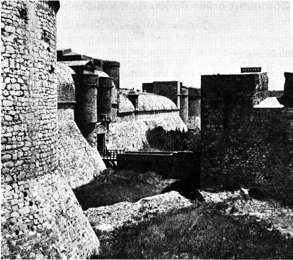
Fossé du front nord avec l'entrée de la forteresse

pour éviter de voir l'ennemi s'en servir (à l'époque de Richelieu) ou pour alléger les charges d'entretien des fortifications (à l'époque de Vauban). Poudrière, prison d'Etat ou casernement occasionnel, Salses est finalement classée monument historique en 1886. Affectée dès 1930 à l'Administration des beaux-arts, cette forteresse extraordinaire est l'objet de grands travaux de restauration, de sorte que l'homme d'aujourd'hui trouve, si ce n'est dans la visite, du moins dans la lecture de cette étude si vivante, le reflet d'une époque de grandeur dont l'architecture est le témoin privilégié.