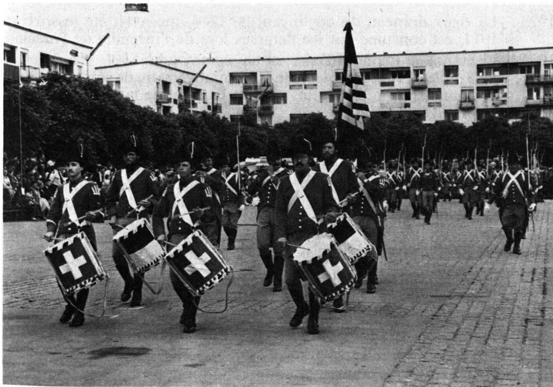
Fifres et tambours ouvrent la marche.

Cependant, les journées de juillet 1914 avaient été si magnifiques, si suggestives aussi, que la Première Guerre mondiale, la longue mobilisation, et même les événements de 1918 n'étaient pas parvenus à en effacer le