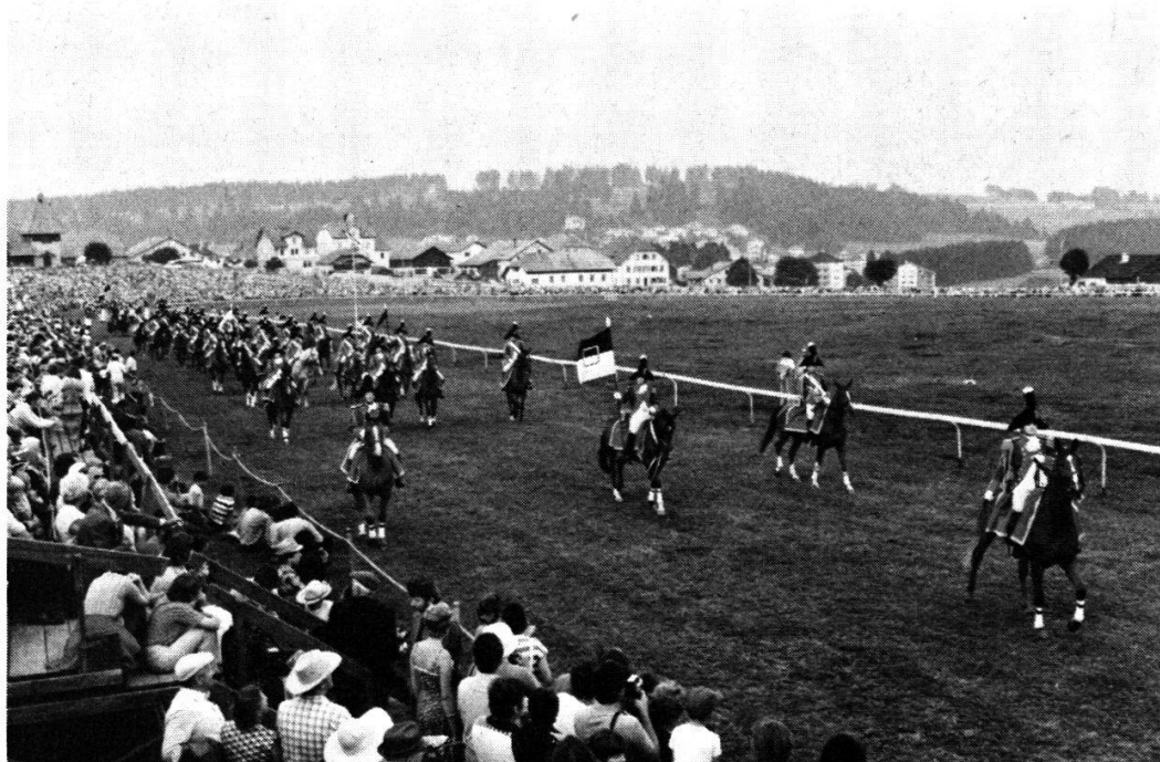
Le Cadre Noir et Blanc lors de sa première sortie à Saignelégier, en août 1980.

Il s'adressa à la Fédération fribourgeoise des sports équestres, présidée par M. Guy von der Weid, et s'efforça d'intéresser les cavaliers à son projet. On prit alors contact, par écrit, avec plus de deux mille cavaliers et amis du cheval, afin de donner une base tout à fait large et démocratique au groupe à créer. Les réponses, plus nombreuses que prévu, furent encourageantes tant par les promesses de soutien que par l'inscription de cavaliers prêts à assumer l'effort matériel et de discipline que requiert l'affiliation à une troupe montée.