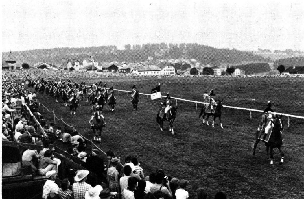
Le Cadre Noir et Blanc lors de sa première sortie à Saignelégier, en août 1980.