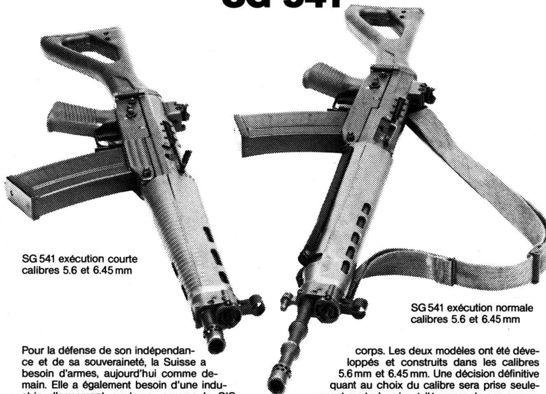
SG 541 exécution courte calibres 5.6 et 6.45 mm