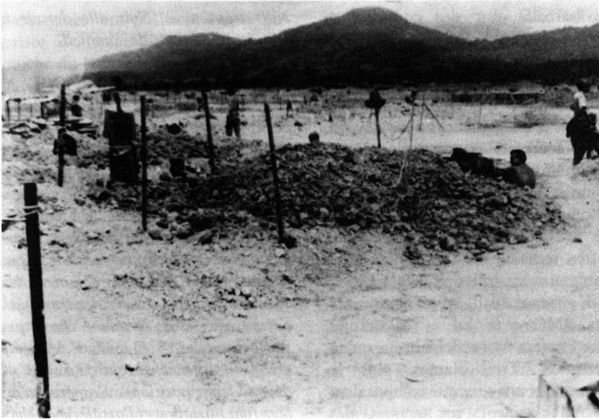
Diên Biên Phu. Vue vers le N-Est depuis le PA Claudine. Au second plan, à gauche, un Dakota.

quelconque ici à Diên Biên Phu doivent être plus inquiets et avoir plus de peur que nous-mêmes.