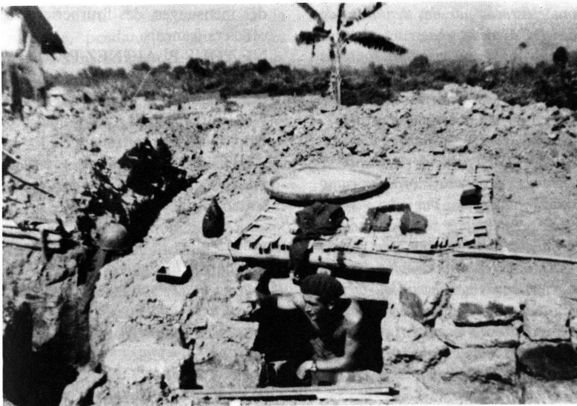
Diên Biên Phu. Un sergent suisse de la 13 e DBLE devant son abri.

V.M. sur les positions de la 3/13. Combat dure jusqu'à 0500 du matin, le V.M. reste maître. 80 survivants reviennent de la 3/13 et renforcent notre bataillon. Le V.M. a laissé env. 1000 cadavres sur le terrain. Notre lieutenant toubib blessé également. Deux cinéastes, correspondants de guerre, ont voulu faire des photos pendant le tir d'artillerie V.M. sur le terrain d'aviation. L'un est tué, à l'autre manque une jambe.