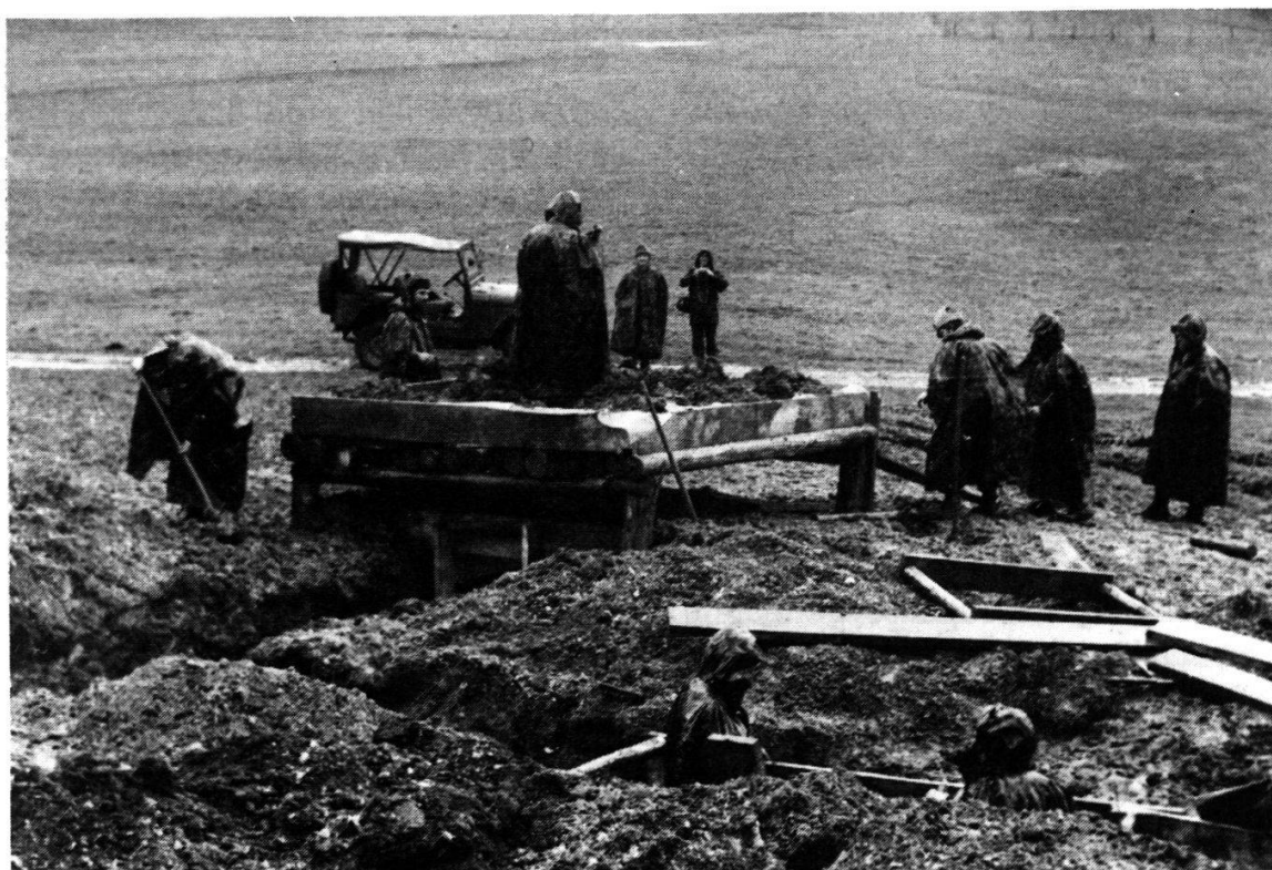
et que l'infanterie légère peut survivre dans des positions préparées aux feux combinés des chars, de l'artillerie et de l'aviation