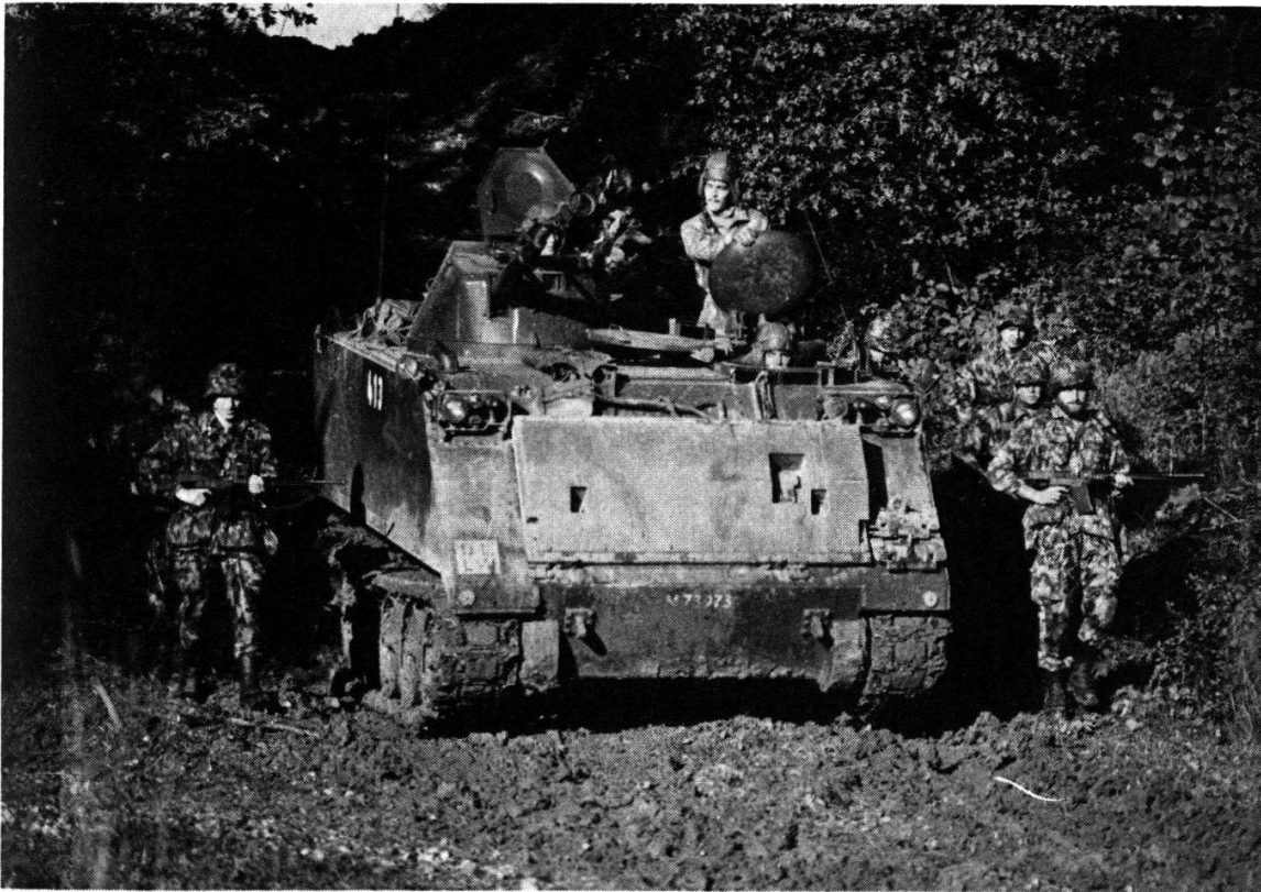
Des études sérieuses montrent qu'il n'est pas rentable de mécaniser toutes les formations de combat...