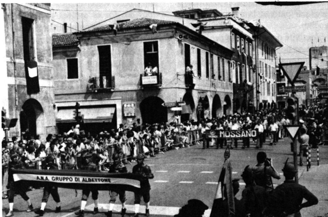
Défilé dans les rues de Cittadella des différentes sections de l'ANA.