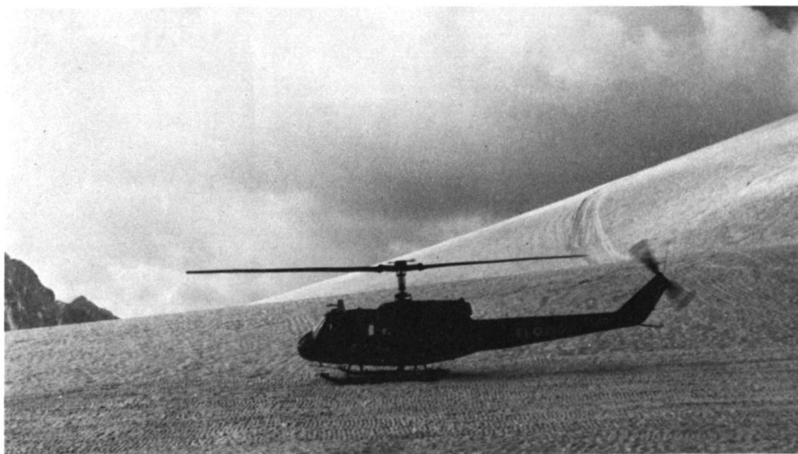
Hélicoptère Agusta Bell AB 205 lors d'un vol dans les Alpes du Haut Adige.

symétriquement disposées et déclenchées par paires (six à droite et six à gauche).