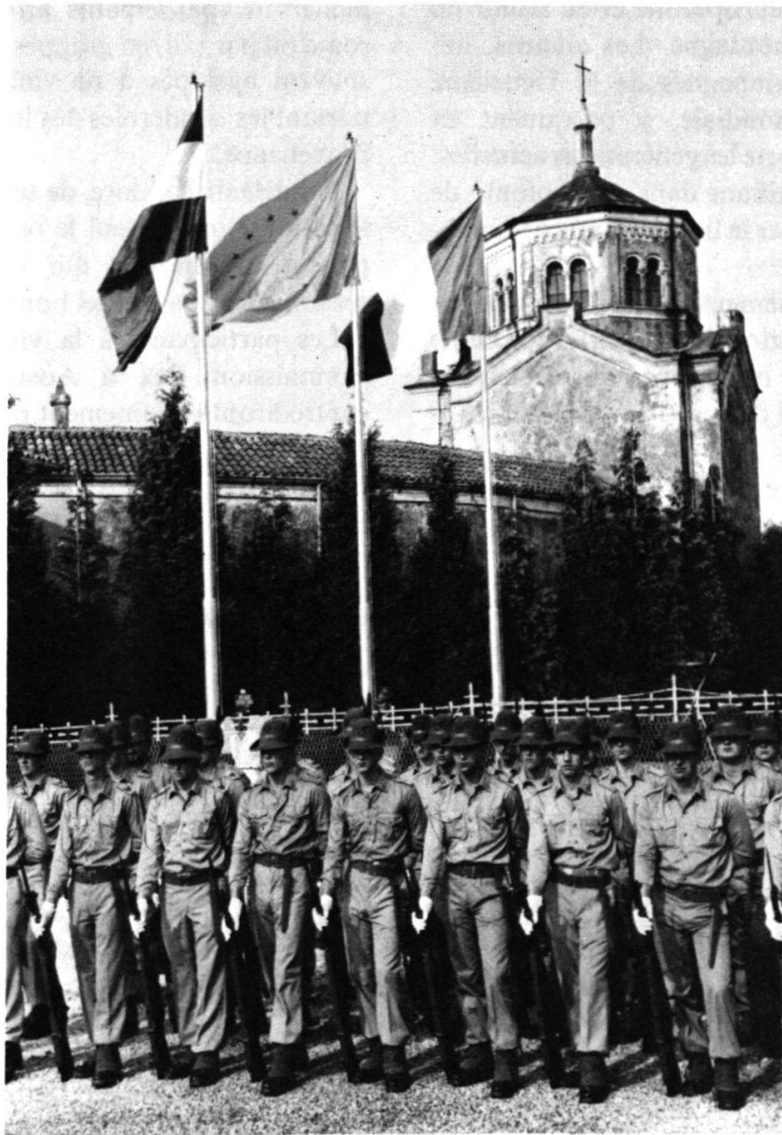
Les manifestations de l'ANA soulignent l'esprit européen. Ici au cimetière autrichien de Cittadella, avant la pose de la plaque commémorative, une section d'honneur a été déléguée par la brigade « Julia ».