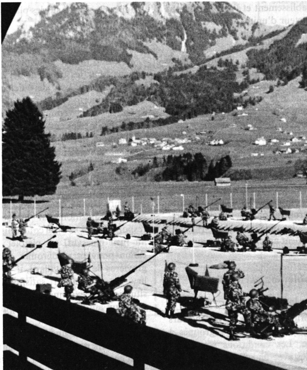
Figure 2. – Exercice de pointage avec l'installation Florett sur la place de tir de Grandvillard.

troisième semaine de service en campagne, sur le modèle de la deuxième, combinée avec l'exercice de survie ordonné par le chef de l'instruction de l'armée. A part les restrictions imposées dans le domaine de la nourriture et du logement, la nouveauté principale sera pour la troupe la marche de 50 km qui permettra de regagner