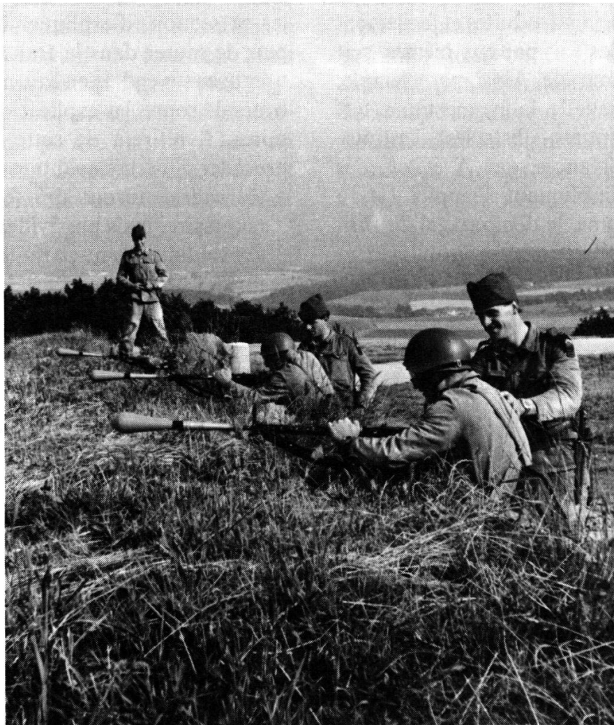
Sur la position de tir : pour chaque tireur, un moniteur

Plus encore que pour le tir à balle, la présence d'un moniteur de tir à côté de chaque tireur est indispensable jusqu'à ce que la confiance en soi et le niveau des résultats soient suffisants. Le travail de la section doit être organisé d'abord en fonction de cet impératif. Ce qui, bien entendu, aura pour