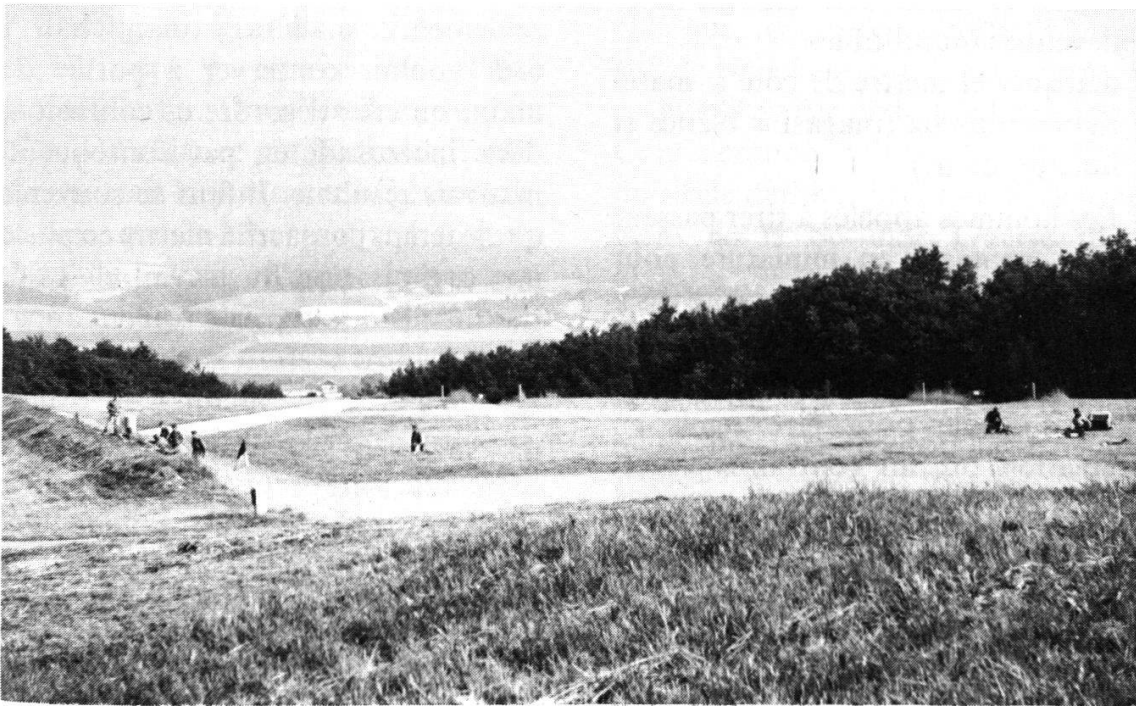
Vue d'ensemble : tireurs, réserve de secours et dépôts clairement séparés

b) Cinq mètres derrière les tireurs se trouve la réserve de secours . Il s'agit d'un soldat qui dispose de deux ou trois magasins pleins et de quelques grenades (avec bouchon si l'on tire sans charge additionnelle) et qui, à la demande du moniteur, apporte séance tenante matériel ou munition de remplacement en cas de dérangement. Peut-être cette réserve ne sera-t-elle