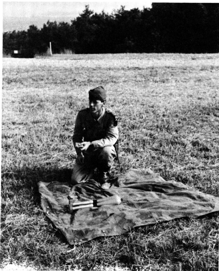
La réserve de secours à proximité de la position

ordre de grandeur d'un tiers en plus de ce qui est nécessaire: qu'il s'agisse du matériel ou de la munition. Mais la réserve en elle-même ne suffit pas: il faut qu'elle soit immédiatement disponible, donc préparée, située à proximité immédiate des tireurs, et desservie par un homme prêt à répondre à la sollicitation du directeur de tir ou d'un moniteur en agissant selon le «Bringprinzip».