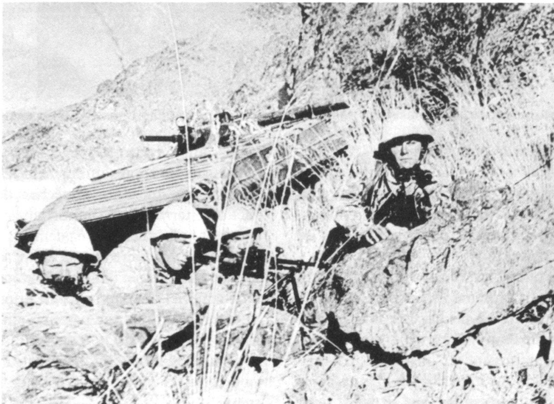
Soldats soviétiques (?) en position quelque part dans la montagne afghane. Derrière eux, un BMP avec son canon de 73 mm.

Exploitant toutes les possibilités des routes, les troupes soviéto-afghanes lancent des incursions blindées, style «coup de poing», dans les plaines, les plateaux et les vallées. Un convoi comprenant environ quarante chars de grenadiers et vingt chars de combat se lance sur un axe. A un moment