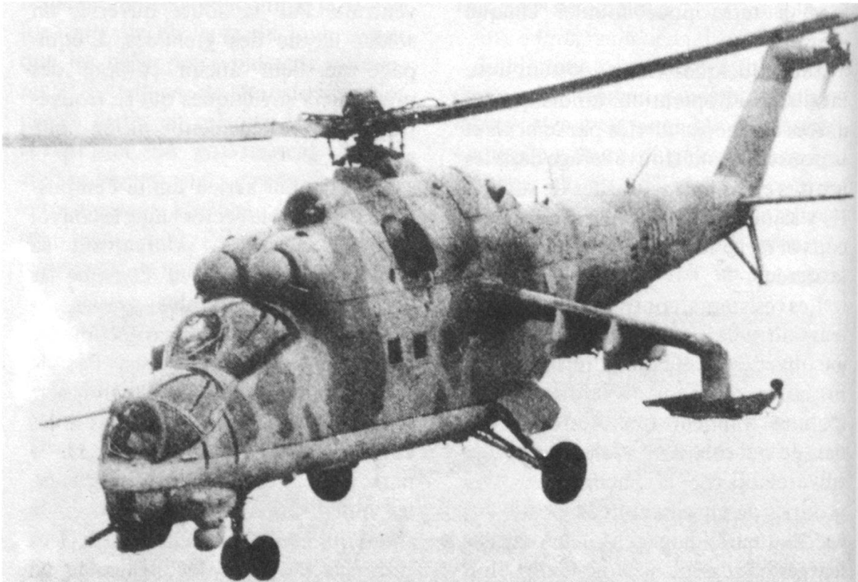
L'hélicoptère de combat Mi-24 . A gauche, on distingue les supports pour l'armement, ainsi qu'une mitrailleuse sous le nez de l'appareil.

Les moudjahidines comptent sur leur courage et leur débrouillardise pour combattre les engins sophistiqués de l'ennemi: ils abattent des hélicoptères blindés en cherchant un emplacement qui se trouve au-dessus de la ligne de vol de ces engins. En tirant, même avec un fusil, sur les superstructures d'un Mi-24 , on peut lui infliger de gros dégâts et même, avec de la chance, le descendre. Les résistants creusent des pièges dans lesquels s'immobilisent les chars qu'ils détruisent ensuite à courte distance 8 .