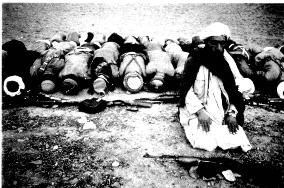
Les moudjahidines combattent pour une conception théologique et sociale de l'Islam...

gagner la population [...]. Au contraire, il s'agit là d'un mouvement spontané et populaire qui devra, à terme, accoucher de «leaders» à dimension nationale dans lesquels il se reconnaîtra.» 4