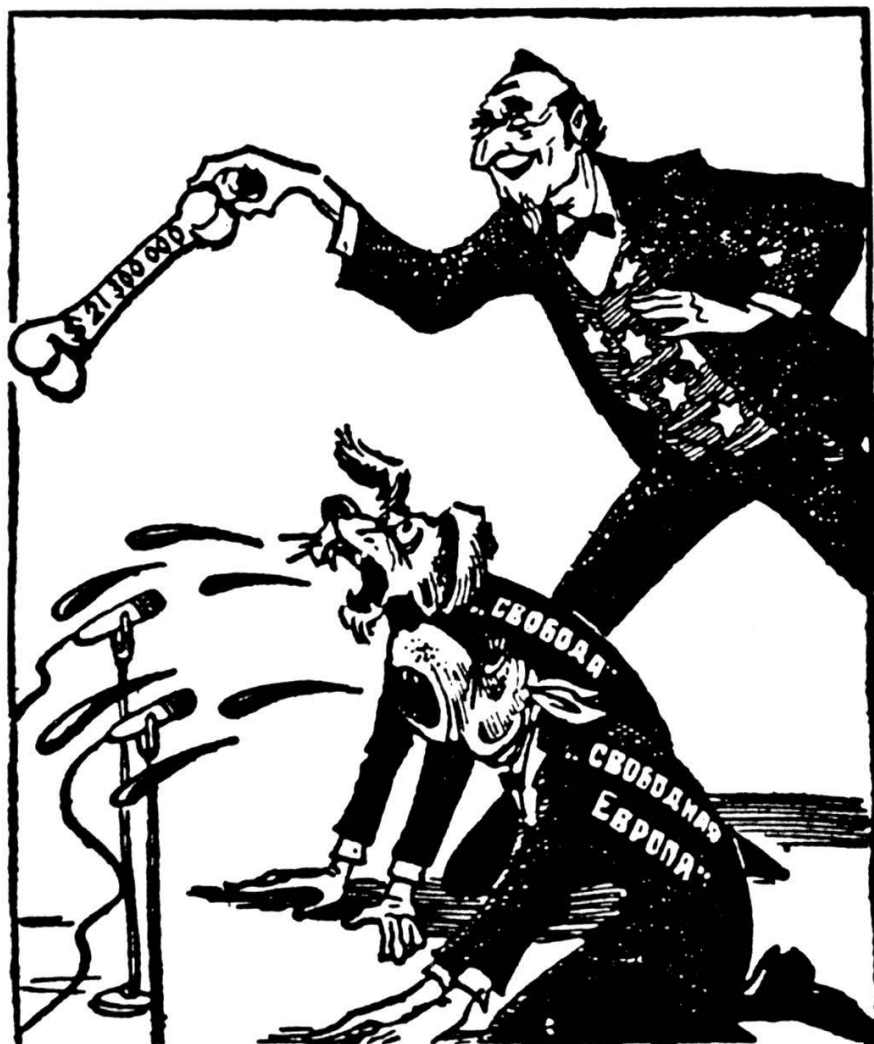
Europe libre. «Pravda».