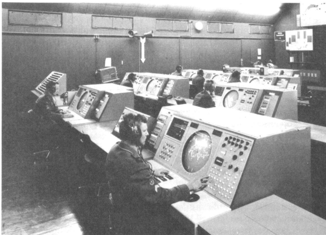
L'interception d'aéronefs est dirigée à partir d'une centrale d'engagement, en étroite liaison avec la sécurité aérienne civile.

L'histoire du trafic aérien est simultanément celle des incidents aériens. En 1904 déjà, on a ouvert le feu pour la première fois contre un ballon qui avait pénétré dans un espace aérien étranger. Les débuts du trafic aérien motorisé marquèrent simultanément le début d'une chaîne ininterrompue jusqu'ici de violences contre des appa-