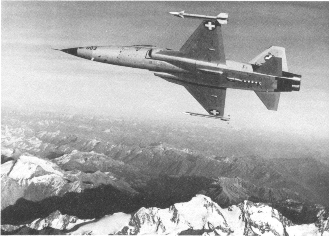
Le Tiger F-5E se prête bien à l'exécution de tâches de police aérienne.

N'est pas réglée non plus la défense de l'espace aérien dans le cas d'une attaque armée puisque la défense se base sur le droit de la guerre et peut s'appuyer normalement sur la Charte des Nations Unies.