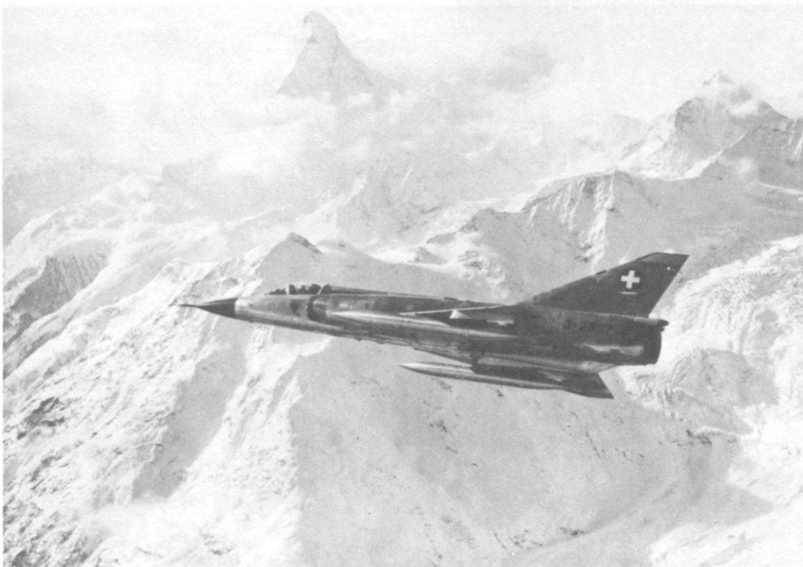
Le Mirage se prête bien à l'interception par tous les temps et, dans sa version de reconnaissance, également à l'identification de nuit.

Selon la loi fédérale sur la navigation aérienne (LNA), le Conseil fédéral dispose depuis toujours de la compétence d'édicter des prescriptions sur le maintien de la souveraineté sur l'espace atmosphérique. Ce n'est que ces dernières années qu'il s'est révélé que des normes de police aérienne étaient nécessaires pour régler les mesures et les compétences en vue d'imposer les prescriptions sur l'utilisation de l'espace aérien suisse. L'ordonnance comble une lacune et permet de faire respecter la souveraineté sur l'espace atmosphérique en pleine conformité avec le droit inter-