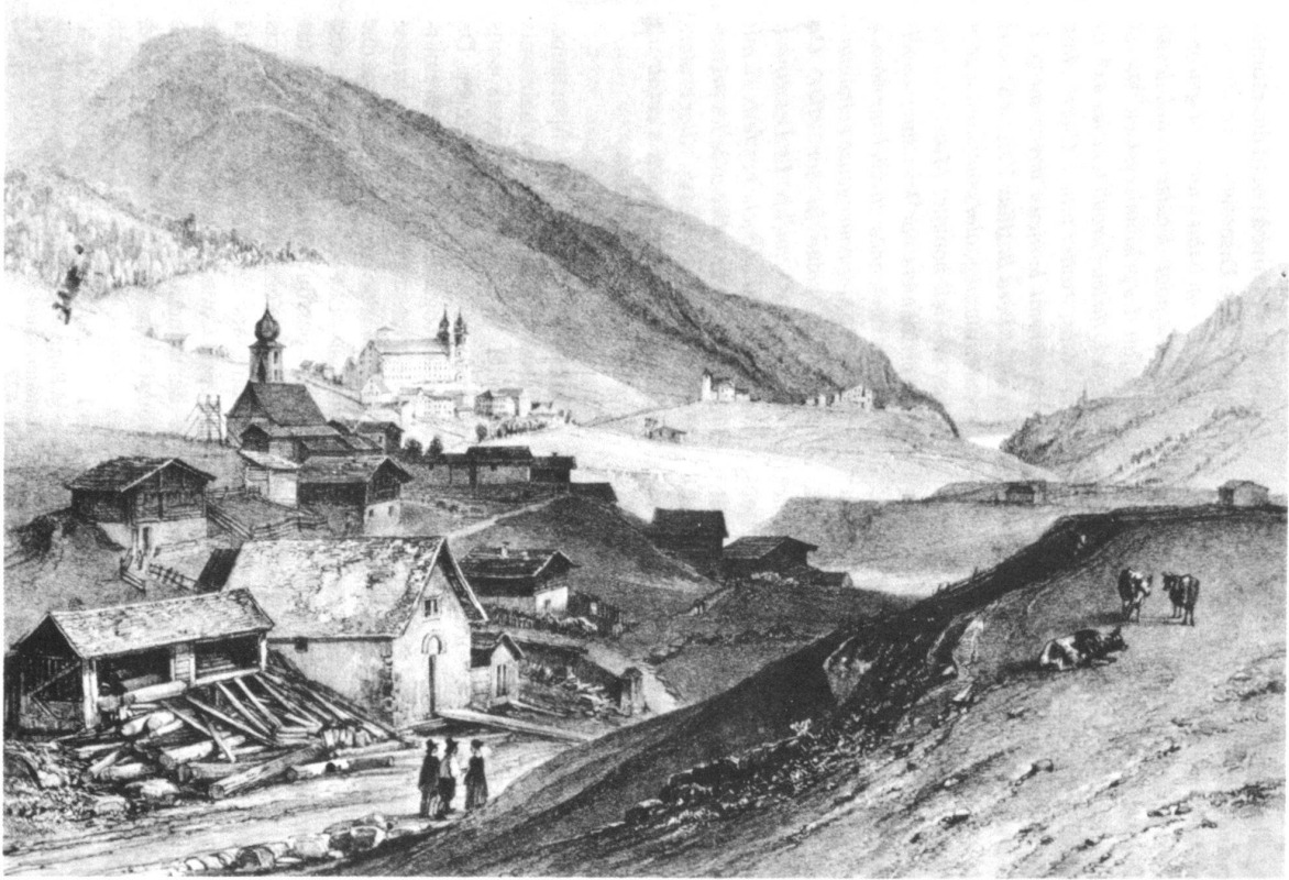
Disentis ver 1830. Lithographie par J. Jacottet d'après Chapuy.