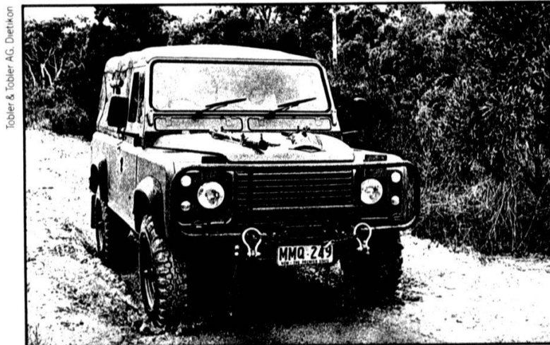
Tobler & Tobler AG, Dietikon