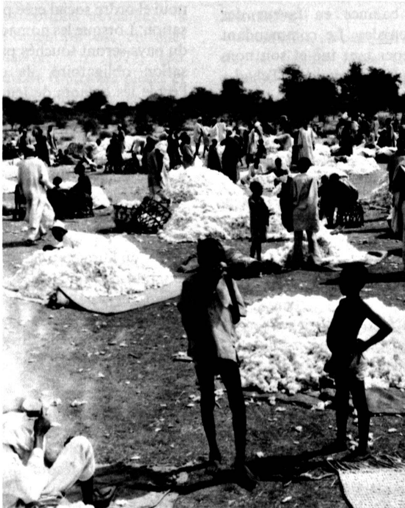
Dans le Sud: le marché du coton.