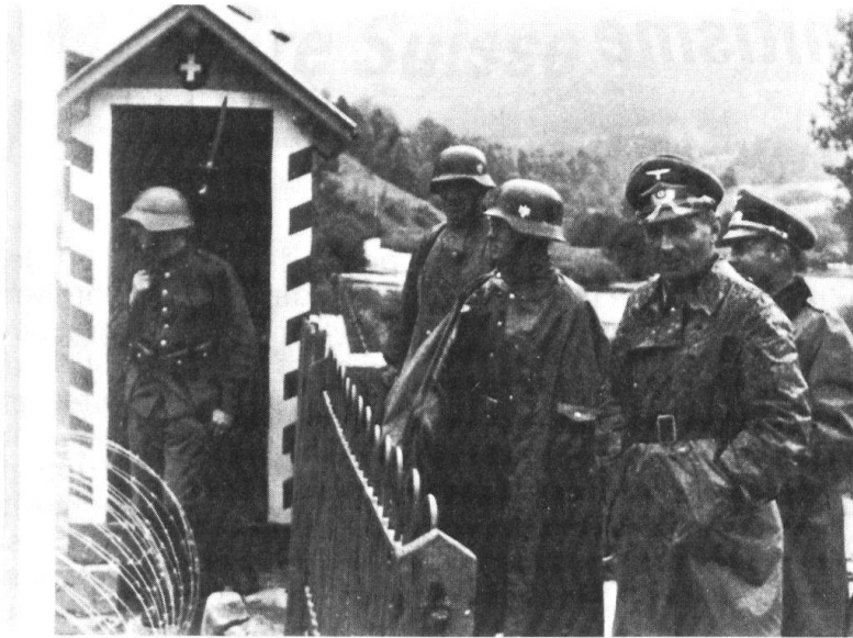
Soldats allemands au poste frontière de Goumois en juin 1940

Le commandement allemand connaît les faiblesses du dispositif de Guisan. Zurich, Lucerne et Berne devraient être occupées dès le deuxième jour d'opérations. Les effectifs prévus sont bien inférieurs à ce qu'envisageront les études opératives ultérieures. Neuf divisions articulées en quatre corps d'armée devraient suffire; la collaboration des Italiens n'est pas envisagée.