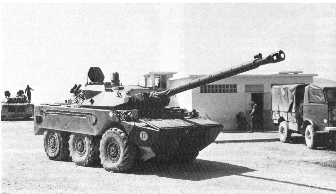
L'AMX-10 RC équipait notamment le 1 er régiment étranger de cavalerie de la division Daguet.

bombardements aériens intenses détruisirent les centres nerveux de la défense irakienne (centres de commandement et de transmission), ses moyens d'attaque (pistes, bases, avions au sol, infrastructure) et toute sa logistique (dépôts de carburant, munitions, matériels). Puis la zone à conquérir fut isolée par la coupure des voies de communication des premières lignes (ponts sur le Tigre et l'Euphrate, comme en 1944 les ponts sur la Loire et sur la Seine). La grande manœuvre d'assaut commencée le 17 janvier et terminée le 28 février fut lancée alors que toutes les conditions de sa réussite se trouvaient réunies en évitant le scénario auquel l'état-major irakien s'attendait: une attaque venant du sud sous la forme d'une opération amphibie avec un débarquement de Marines sur les côtes koweïtiennes – hypothèse que l'état-major allié a entretenue par une gigantesque opération d'intoxication avec la complicité de la presse. La manœuvre d'assaut de la plus formidable machine de guerre réunie depuis la Deuxième Guerre mondiale a consisté dans la combinaison complexe d'une énorme puissance de feu et de mouvements rapides et amples – un montage difficile exécuté avec virtuosité.