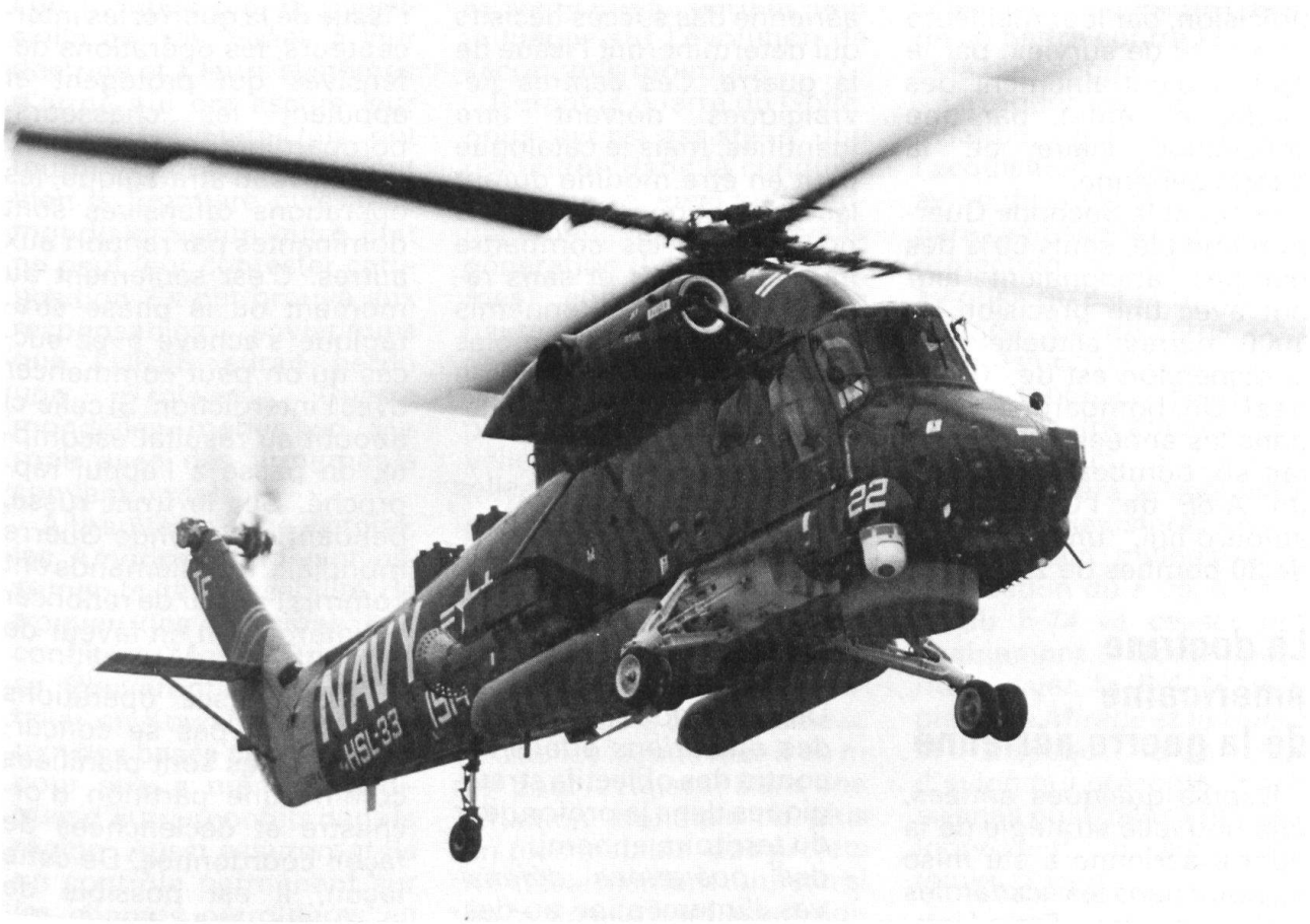
Les systèmes d'arme engagés contre l'Irak étaient aptes aussi bien au combat de jour que de nuit. Ici, un hélicoptère de l'US Navy équipé d'un dispositif de vision de nuit que l'on distingue au-dessous du poste de pilotage.

guerre et les généraux soviétiques doivent le considérer comme une leçon pénible à admettre et à digérer.