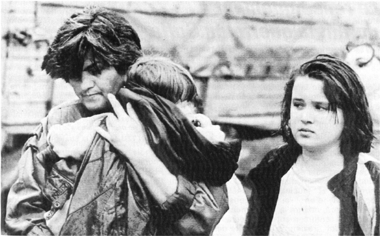
Les réfugiés sont dans tous les camps: ici, des réfugiés serbes, venant de la ville croate de Vukovar. Des milliers de Serbes ont fui les régions où se déroulent les combats pour s'établir à l'intérieur de la Serbie ou en Voïvodine.

l'émergence des problèmes nationaux, dans laquelle les rôles et fonctions des différents niveaux et organes sont devenus flous, où la transmission des ordres est problématique et où le soutien, particulièrement en pièces de rechange, est défaillant, bref d'une armée «chaotique», à l'image, pourrait-on dire, du chaos qui règne au niveau économique, politique et idéologique en Yougoslavie.