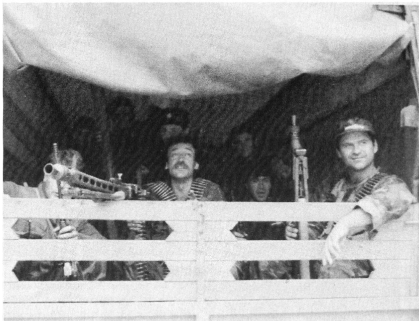
Des membres de la Garde nationale croate, qui font plus penser à des partisans qu'à des militaires, se dirigent vers le front à Osijek dans un camion civil.

Pour qualifier les bandes serbes qui terrorisent les régions de Croatie où des Serbes sont établis (la Slavonie à l'est et la Krajina à l'ouest), les journaux ont parlé de « techetniks », souvent sans même utiliser de guillemets. Ce vocabulaire n'est pas innocent, puisqu'on fait référence au mouvement pro-fasciste et grand-serbe dirigé par Draza Mihailovic durant la Seconde Guerre mondiale. Or, ces Serbes, s'ils portent bien le