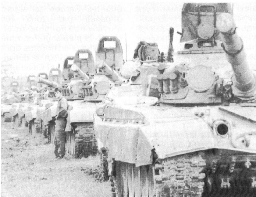
L'armée fédérale a pris position à Sremska Mitrovica, en Serbie, pour s'interposer entre les milices croates et serbes. Tâche pour le moins délicate.

Mais surtout, c'est la nature de l'« armée populaire yougoslave », selon la terminologie officielle, qui est en cause ici. En effet, contrairement à ce qui est généralement dit, même si la littérature sur le sujet est très réduite, il ne s'agit pas d'une armée comparable aux armées classiques, en particulier au niveau de la discipline. Il s'agit d'une armée segmentée, dans laquelle l'idéologie marxiste de type autogestionnaire qui servait de ciment n'existe plus, dont les structures organisationnelles très complexes 8 se sont effondrées à la suite de