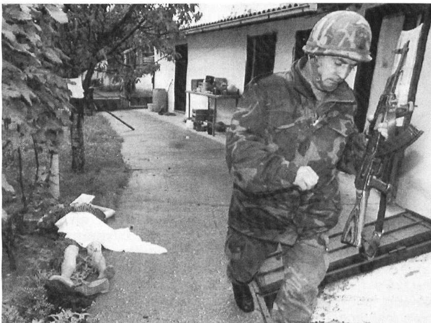
Une image qui a fait le tour du monde: un soldat croate qui s'enfuit sous le tir de miliciens serbes, après avoir recouvert le corps d'une vieille femme tombée sous les balles. La scène se passe dans le village de Sarvas, près d'Osijek, capitale de la Slavonie.

Il est établi que des officiers slovènes ont commandé des unités de l'armée fédérale en Slovénie. Cela a d'ailleurs été une grave er-