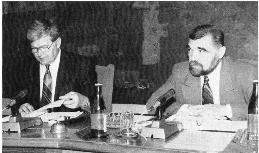
Le président Stipe Mesic (à droite), d'origine croate, a été le seul membre de la Présidence collégiale à s'opposer au cessez-le-feu, sous prétexte que la Commission de surveillance de son application devait être dirigée par le Monténégrin Branko Kostic (à gauche), proche des positions serbes. Cette attitude scandaleuse d'un «président» a été totalement passée sous silence dans la presse occidentale, qui a insisté sur les seules responsabilités de la Serbie dans l'échec de la quatrième tentative de médiation de la «troïka» européenne.

Inversément, l'armée fédérale n'est pas exclusive-