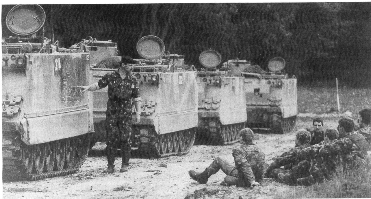
L'officier de carrière, un enseignant qui doit se montrer capable de motiver ses «élèves», même si le tableau noir est une plaque de blindage...

Sur la base des conclusions intermédiaires auxquelles nous sommes parvenus, mais aussi sur la base de l'expérience du métier, il importe maintenant de se demander sur quelle voie il conviendrait de