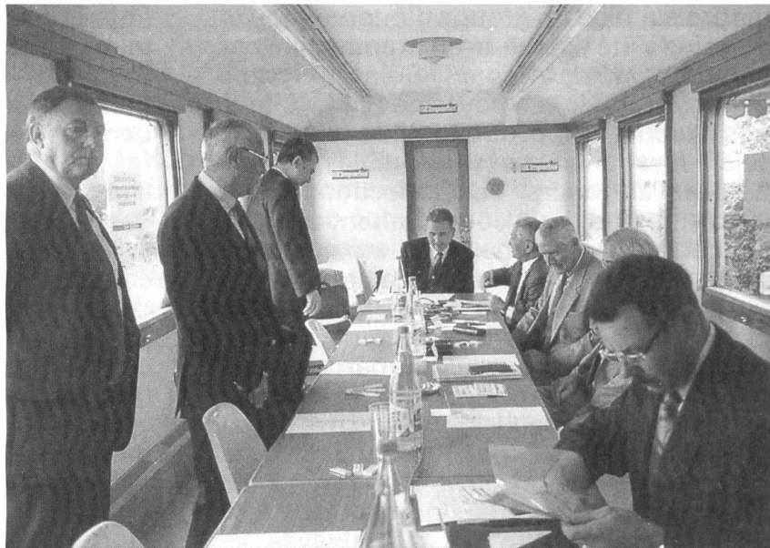
Le wagon réservé aux participants à une rencontre franco-suisse consacrée aux armées de demain... Le public se trouve dans le wagon voisin.

Selon Daniel Collard, maître de conférence à l'Université de Besançon, notre continent est passé du XX e au XXI e siècle avec dix ans d'avance sur le calendrier, puisqu'un ordre nucléaire bipolaire a cédé la place à un «désordre» international multipolaire. Après l'ère des certitudes, l'ère des incertitudes. La fin de la guerre froide a réactivé le rôle de l'ONU, preuve en soit l'intervention des puissances coalisées contre l'Irak sous l'égide de l'ONU. «L'effondrement du système communiste, après le coup d'Etat avorté du 19 août, l'effondrement du centre de l'empire soviétique survient après l'effondrement qui a eu lieu à la périphérie. La fin du système marxiste-léniniste en URSS et l'éclate-