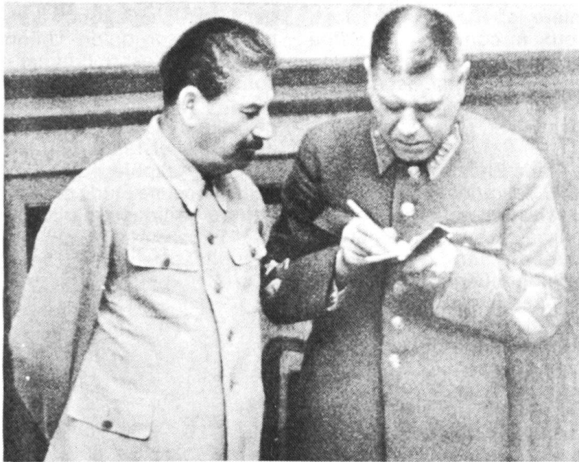
Staline et Chapochnikov en 1939.

L'«essai de biographie politique» tenté par Volkogonov