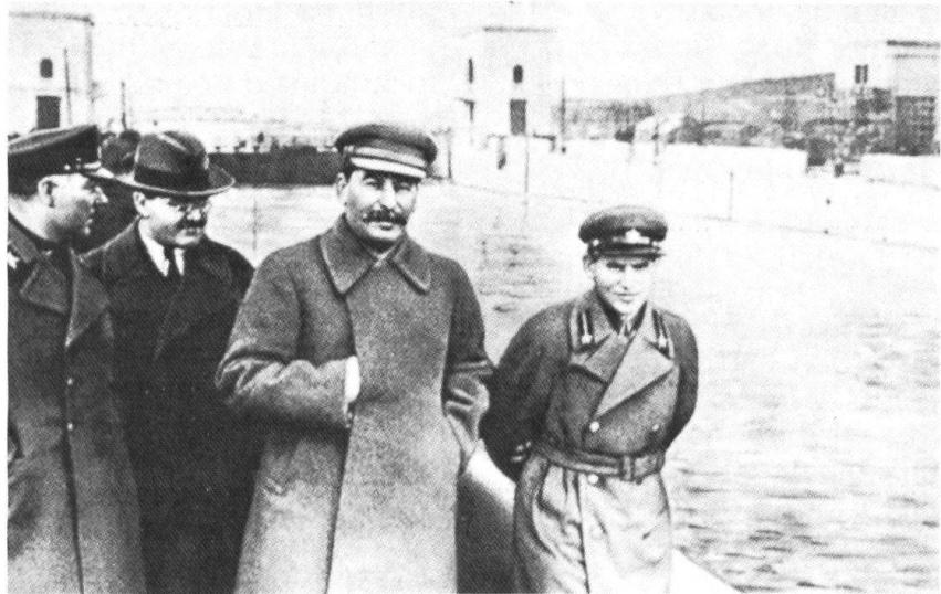
Manipulation photographique au gré des époques: au bord du canal Moscou-Volga, Staline entouré de Vorochilov, de Molotov. Ejov, à droite, «disparaît» en 1937.

Contrairement à ce que prétendait l'histoire officielle soviétique, Staline n'a jamais été, avec Lénine, le chef de la Révolution; il n'y a joué que des rôles de second plan. A la fin de sa vie, Vladimir Ilitch, se méfiant de Staline, avait d'ailleurs proposé de ne pas le laisser à son poste de secrétaire général du parti; au XVII e Congrès, un quart des délégués vote contre Staline.