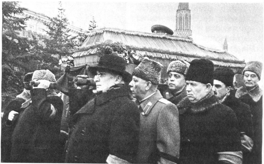
L'enterrement du «Chef»: au premier plan, Beria, Vorochilov et Khrouchtchev.