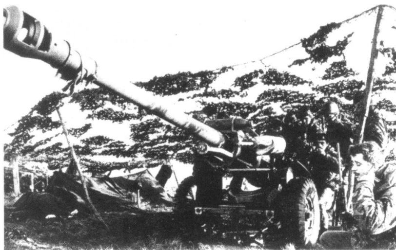
Royal Ordnance Factory de 105 mm.

D'autre part, en avril 1982, la Royal Navy est à la veille de se séparer des porte-avions Hermes et Invincible , de véritables plateformes aériennes sans lesquelles une expédition dans l'Atlantique Sud n'aurait plus été concevable. A l'époque, l'informa-