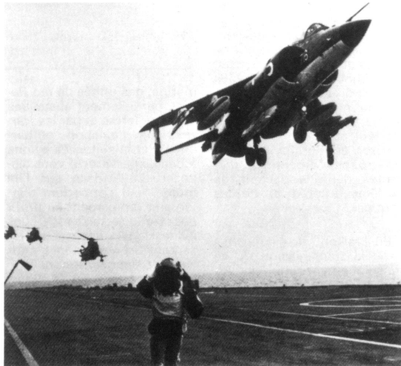
Aux Falklands, les Britanniques engagent leurs Harriers à décollage vertical, qui peuvent partir d'un porte-avions ou d'une simple prairie.

Cette mission, formulée relativement tard (le 9 mai 1982), résulte d'un compromis entre six variantes proposées par les différentes armes (marine, aviation et troupes terrestres). Contrairement à l'opinion exprimée à l'époque par certains spécialistes internationaux, le choix de la Baie de San Car-