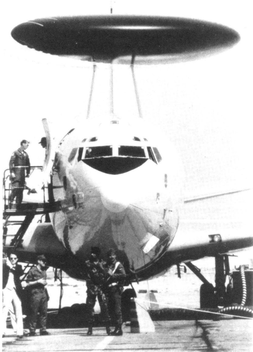
Dans les années qui viennent, la Suisse sera-t-elle amenée à participer à un réseau d'alerte au niveau du continent. Ici un AWACS.

permettre d'atteindre nos objectifs en matière de politique de sécurité, garde le nom de Défense générale . A notre avis, ce terme est trop restrictif; on aurait pu montrer, en choisissant une désignation nouvelle, qu'il ne s'agit pas seulement de l'ensemble des mesures en vue de la défense et de leur organisation, mais aussi d'une politique active et