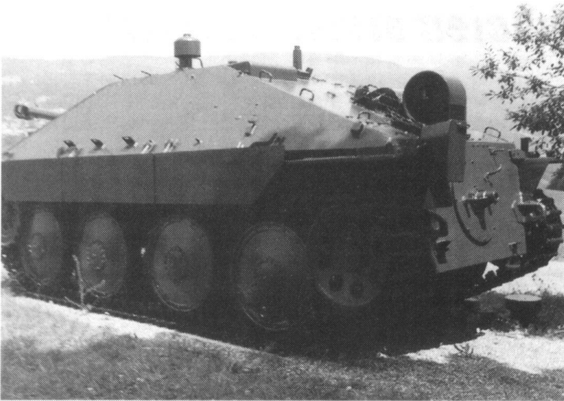
Chasseur de chars G-13.

Malgré l'ouverture d'esprit de certaines de ses têtes pensantes et la clairvoyance de «prophètes» nationaux et étrangers qui collaborent à la Revue militaire suisse , l'armée helvétique n'aligne que 24 chars