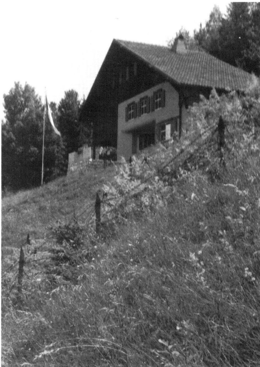
Ce chalet «inoffensif», un des ouvrages du Pré-Giroud édifié à la veille de la Seconde Guerre mondiale dans le secteur de Vallorbe (Photo H. W.).

Les brigades de montagne, qui étaient en fait des «grandes divisions», perdent leurs troupes de forte-