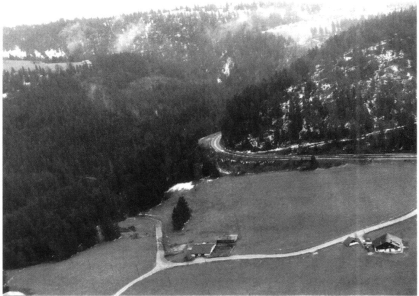
Les secteurs attribués aux brigades frontière, c'est surtout du terrain très fort!

Dans les années qui suivent cette réorganisation, de graves divergences divisent les Alliés de la Seconde Guerre mondiale: c'est le début de la guerre froide, avec des épisodes dramatiques comme, en 1956, la