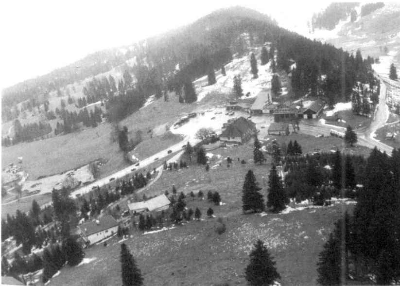
Le col de la Vue-des-Alpes pendant des manœuvres de la Brigade frontière 2 en 1989.

Tout au long du service actif, ces mesures ont assuré au commandant en chef la liberté d'action indispensable à la réalisation des plans de relève et de ses intentions opératives. Ces dispositions n'ont pas éliminé les problèmes que pose l'engagement coordonné de troupes frontière et de formations de l'armée de campagne, les différences au niveau de l'articulation et de l'équipement n'assurant pas l'interopérabilité et la complémentarité.