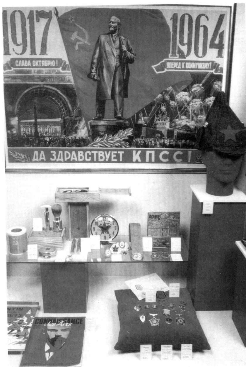
Affiche exposée: «1917-1964. Gloire à Octobre! En avant vers le communisme! Gloire au PCUS!» Musée d'ethnographie, Neuchâtel.

par son idéologie) et directement (Mao, par l'exercice du pouvoir) la mort d'innombrables innocents atteste un mépris sans bornes pour le plus élémentaire des droits de l'homme, le droit à la vie.