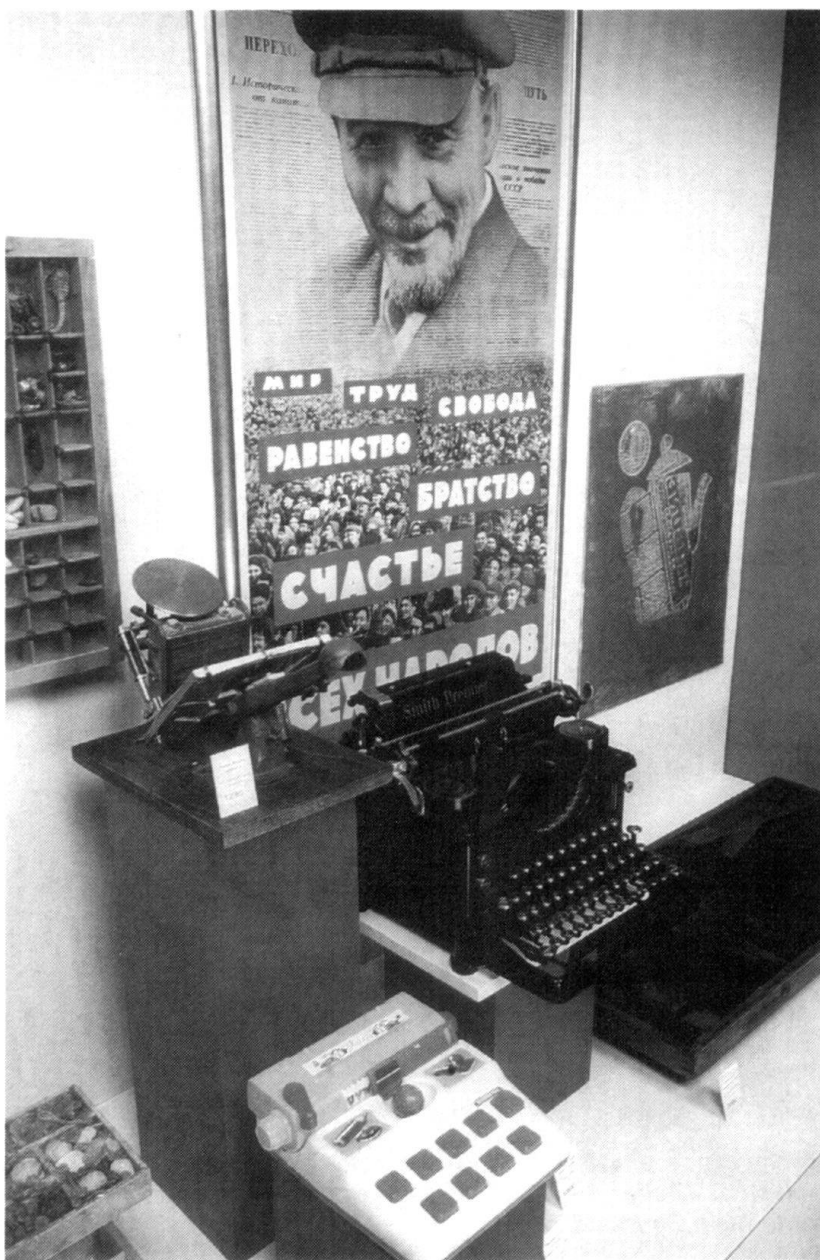
Une autre affiche avec l'effigie de Lénine. Musée d'ethnographie, Neuchâtel.

De même inculque-t-on systématiquement la fausse idée de la «fin des idéologies». L'organisation de l'exposition Marx 2000 est un des exemples qui prouve le contraire. «En une période de capitalisme triomphant, les critiques que Marx adressait il y a plus d'un siècle à cette idéologie