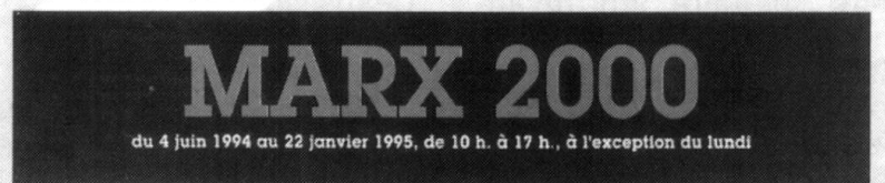
L'affiche de l'exposition (format mondial).

«l'incarnation de la doctrine philosophique du marxisme.» 2 Ils éludent également un texte capital du Manifeste: « Le but immédiat des communistes est (...) le renversement de la domination bourgeoise, (la) conquête du pouvoir politique par le prolétariat. » 3