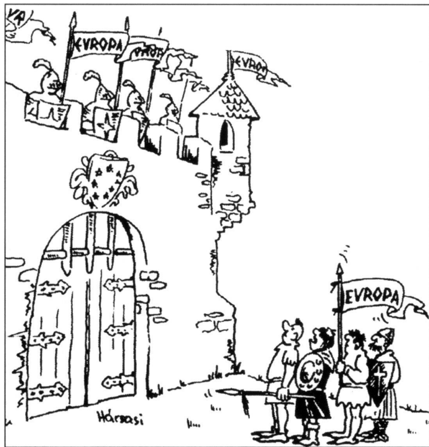
Les Etats de l'Europe de l'Est et l'Union européenne vus par le périodique militaire hongrois Honvédségi Szemle.

Jusqu'en 1989, l'Allemagne se trouvait en première ligne du front Est-Ouest, adossée au Mur de Berlin, partie d'un ensemble qui s'articulait autour du Rhin. Elle se retrouve au cœur d'un continent dont le centre de gravité s'est déplacé. Symbole de ce déplacement, le transfert de sa capitale de Bonn à Berlin. L'Allemagne n'est plus aussi nettement orientée vers l'ouest du continent. A nouveau, comme au XIX e siècle et dans la première moitié du XX e siècle, elle jette un regard tous azimuts et s'interroge sur la manière d'aménager ses relations et sur des modes de coopération possible avec les pays