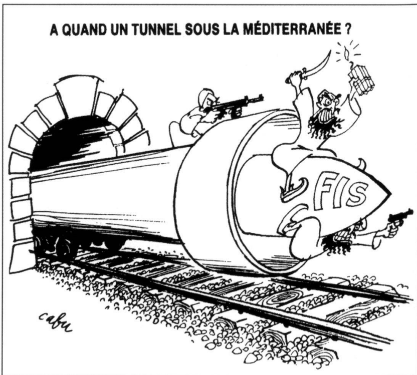
Libre Journal, N° 23-24.

Sur quoi pourrait déboucher la situation actuelle? Première hypothèse, les éléments les plus radicaux de l'armée réussissent un coup d'Etat. Deuxième hypothèse, un régime rigoriste s'installe, résultant d'un compromis entre des militaires et des islamistes influencés par l'Arabie saoudite. Les Européens se la-