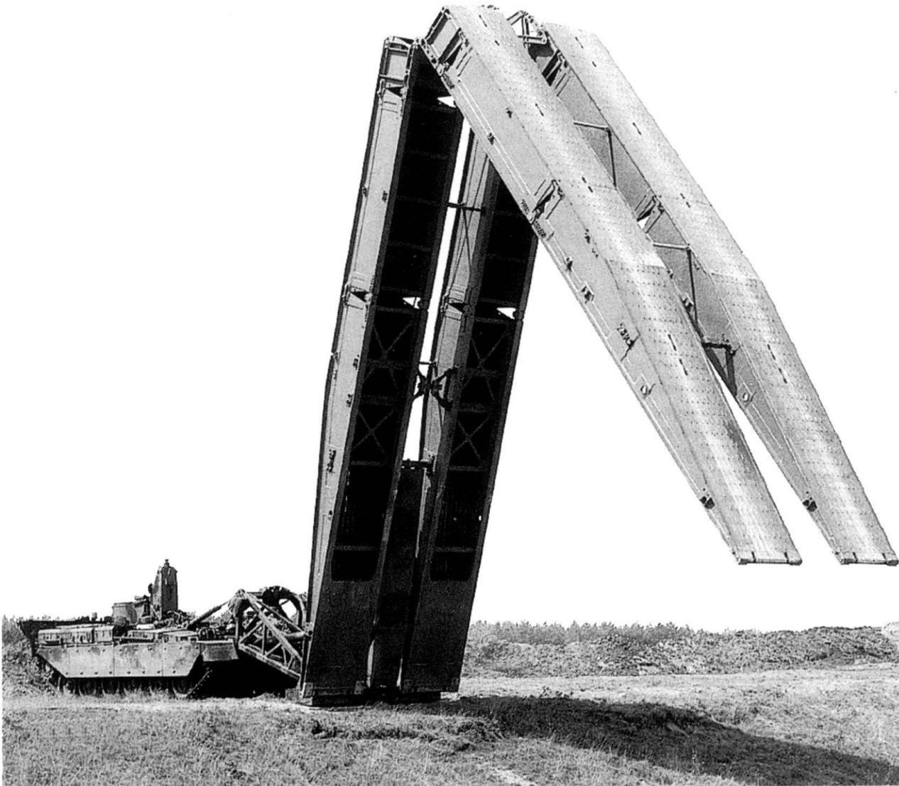
Le BR 90, le nouveau système de pont révolutionnaire.