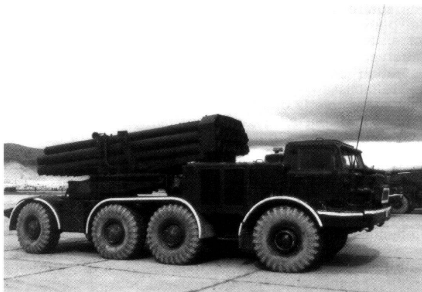
Lance-fusées multiple 220 mm BM-27 (Ouragan). (Armée de Rabbani, Kaboul, avril 1995).

Un autre danger menace à long terme la sécurité, donc la société en Suisse, en Autriche et en Allemagne : les combattants occasionnels dans le contexte de la guerre en Bosnie-Herzégovine. Des ressortissants de diverses factions vivent et travaillent depuis des années dans un pays d'accueil. Ils prennent congé pendant un week-end prolongé, ils profitent éventuellement de leurs vacances, pour se rendre en grou-