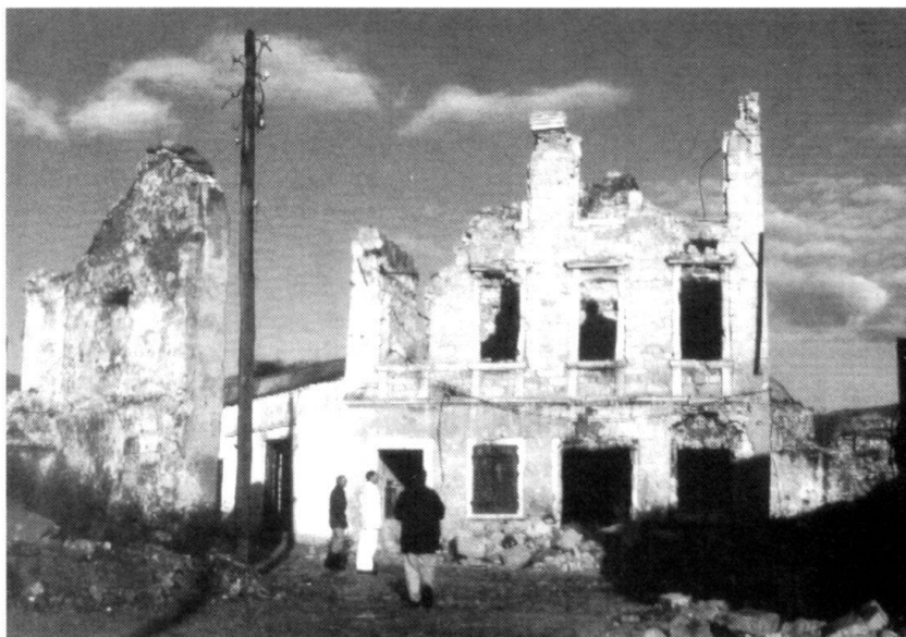
Mostar détruit par les Croates (situation décembre 1994).

Quels sont les retombées de ces guerres pour l'Europe occidentale ? Elles déclenchent des flux migratoires vers l'Europe occidentale, encouragés par des organisations humanitaires qui justifient ainsi leur existence. A long terme, la survie des institutions et des structures sociales des Etats de l'Europe occidentale risque d'être remise en question par de