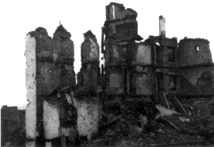
Kaboul (situation avril 1995).

té comme étant le lien entre la guerre absolue et la guerre réelle : « La guerre n'est donc pas seulement un véritable caméléon qui modifie quelque peu sa nature dans chaque cas concret, mais elle est aussi, comme phénomène d'ensemble et par rapport aux tendances qui y prédominent, une étonnante trinité où l'on retrouve d'abord la violence originelle de son élément, la haine et l'animosité, qu'il faut considérer comme une impulsion naturelle aveugle, puis le jeu des probabilités et du hasard qui font d'elle une libre activité de l'âme, et sa nature subordonnée d'instrument et de la politique, par laquelle elle appartient à l'entendement pur. »