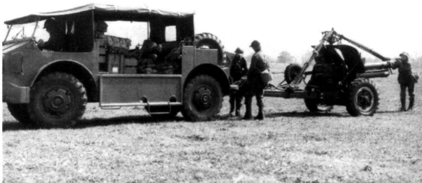
C'est avec l'Armée 62 que l'artillerie tractée cède progressivement sa place aux obusiers blindés, du moins dans les formations de plaine.

Car chacun sait que l'instruction est affaire des