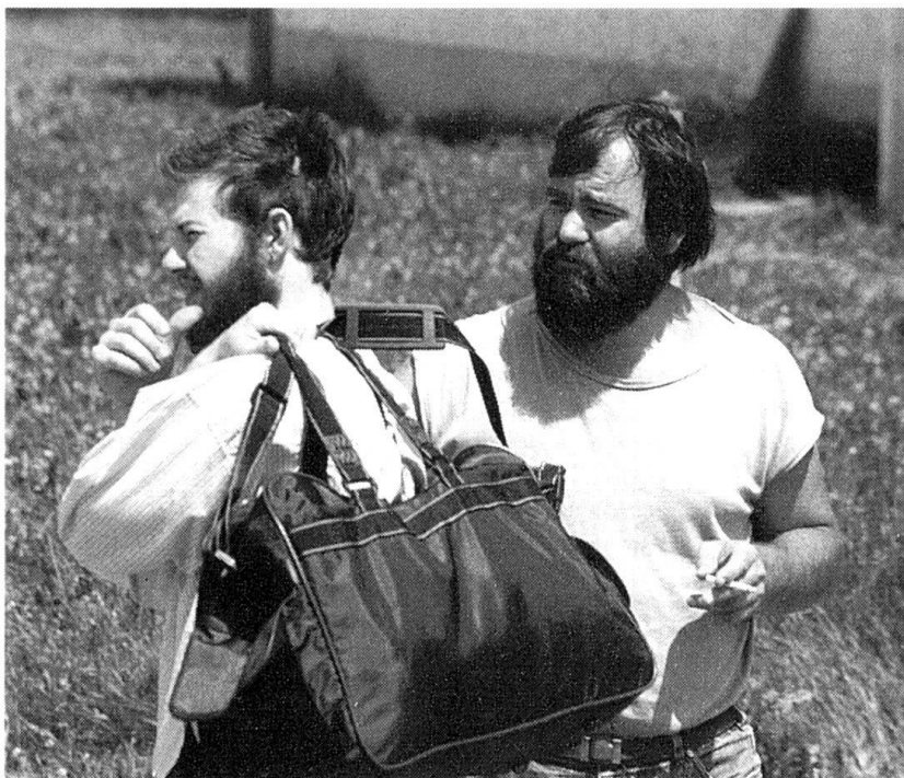
Un grand moment dans la vie d'un jeune Suisse, l'entrée à l'école de recrues. Les citoyens sont-ils prêts à faire un effort gratuit au profit de la communauté?

Analysé globalement, le système de milice s'avère incontestablement efficace et il supporte sans arriè-