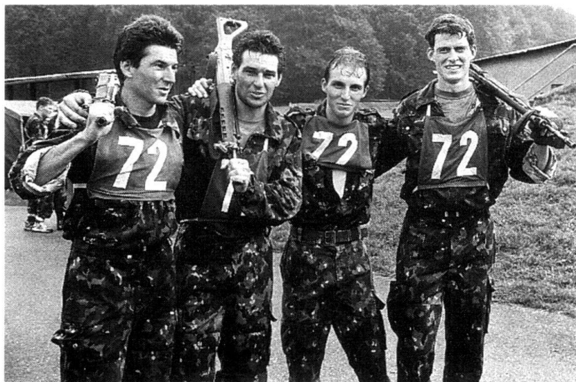
Un système de milice postule la notion d'effort gratuit, et pas seulement dans les concours sportifs hors du service.