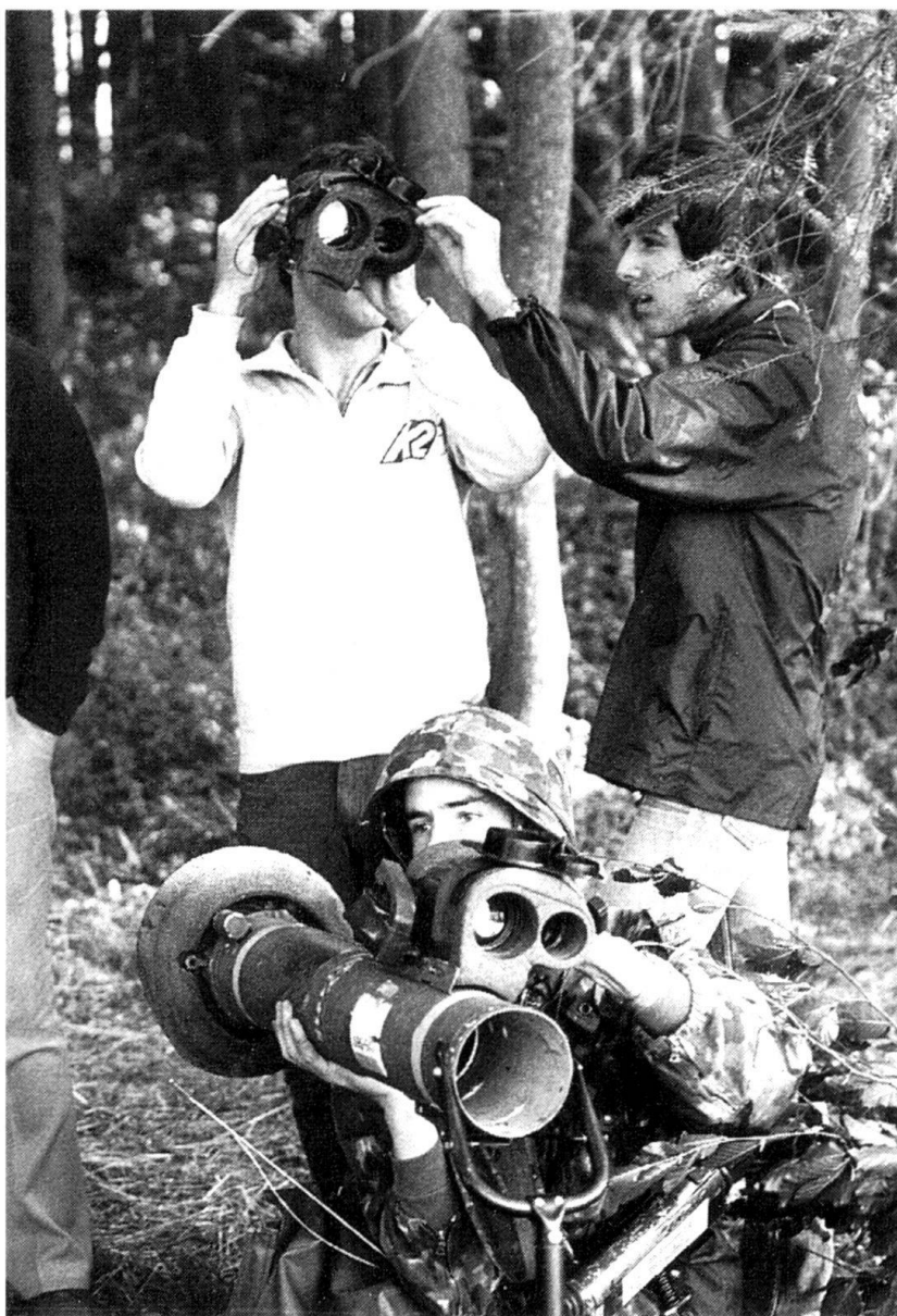
... qui se manifeste toujours lors de la journée des parents dans chaque école de recrues.

Que la pression économique se soit accentuée, c'est un fait, mais n'oublions pas que l'instruction militaire s'est toujours présentée en concurrence avec les intérêts professionnels. Machiavel déjà s'intéresse à ce problème. « Quant au reproche de fatiguer le pays et les citoyens, je soutiens que la milice, quelque imparfaite que soit son organisation, ne fatigue en rien les citoyens, puisqu'elle ne les arrache pas à leurs travaux, ne les éloigne en rien de leurs affaires et ne les oblige qu'à se rassembler les jours de fête pour les