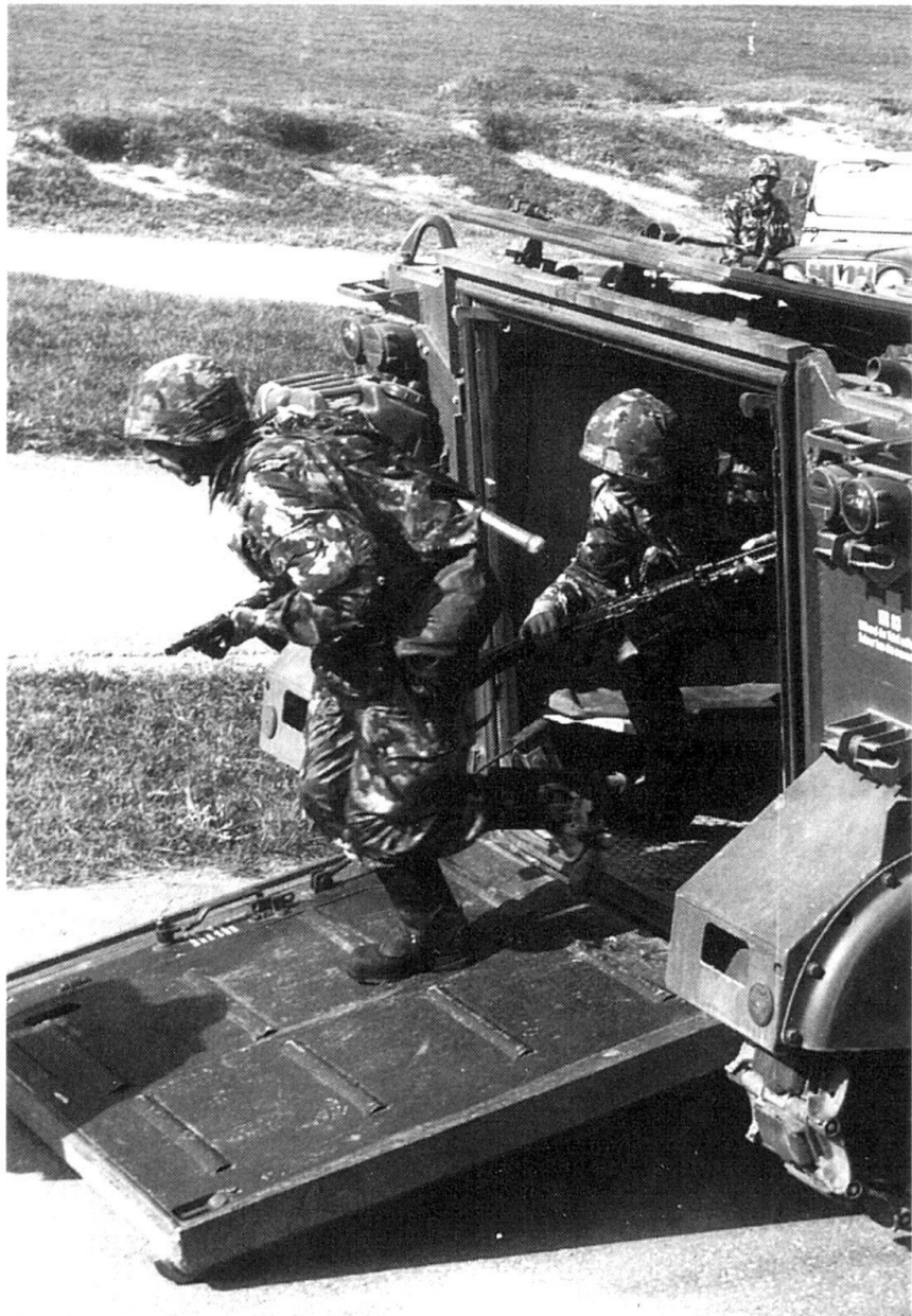
Pourtant, l'efficacité d'une armée de milice ne doit pas être moindre que celle d'une armée de métier.

face d'un ennemi extérieur, mais encore, mais surtout en face de nous-mêmes, de nos égoïsmes, de nos particularismes, de nos aises, de tout ce qu'il y a de centrifuge dans un pays, comme le nôtre, sans unité de race, de langue, ni de religion 10 ? »