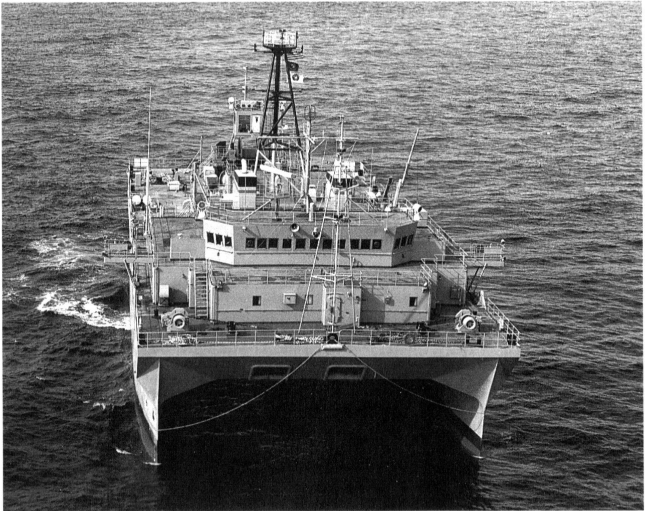
« La diplomatie navale est devenue la voie privilégiée de l'action extérieure ».

mais il revêt aujourd'hui une importance primordiale.